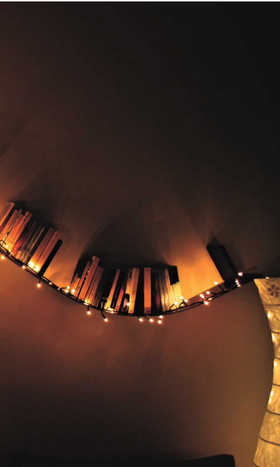
BOOKWORM bookcase des. R. Arad