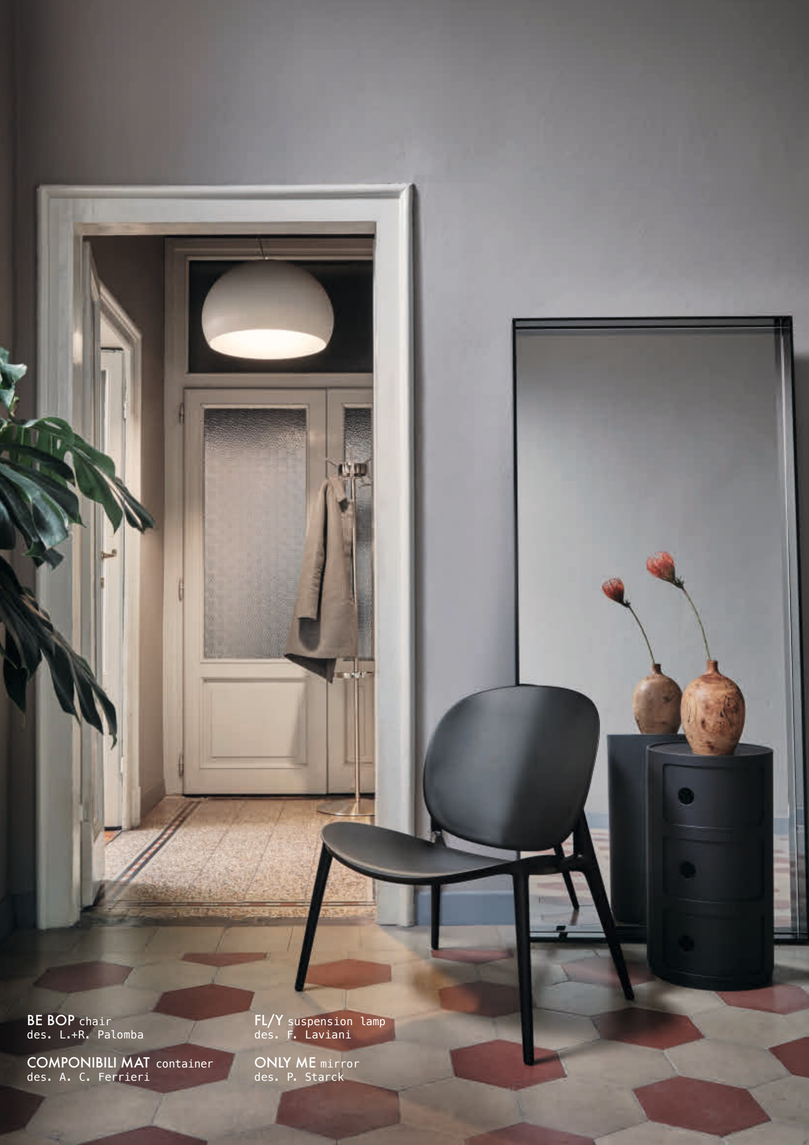
BE BOP chair des. L.+R. Palomba