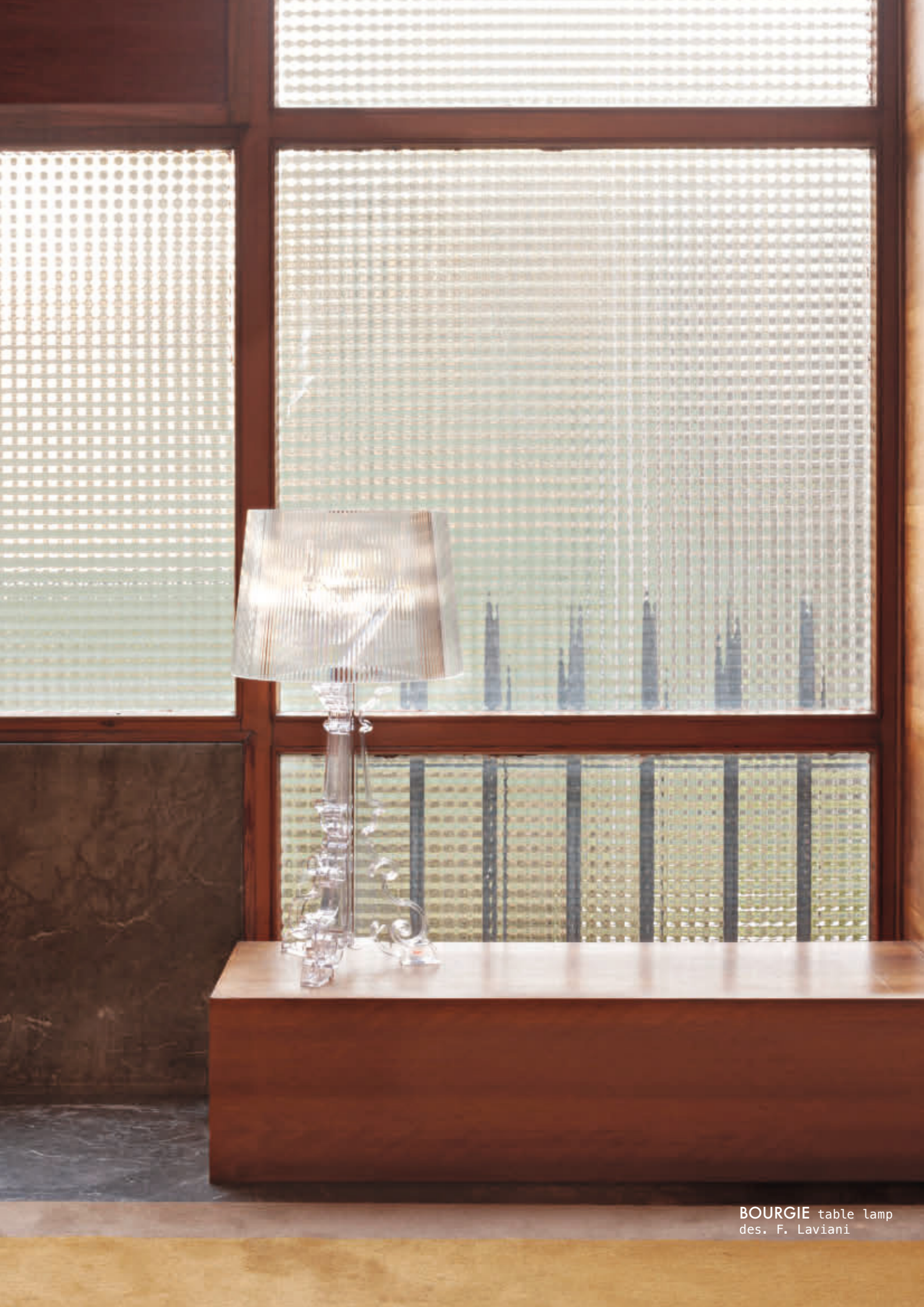
BOURGIE table lamp des. F. Laviani