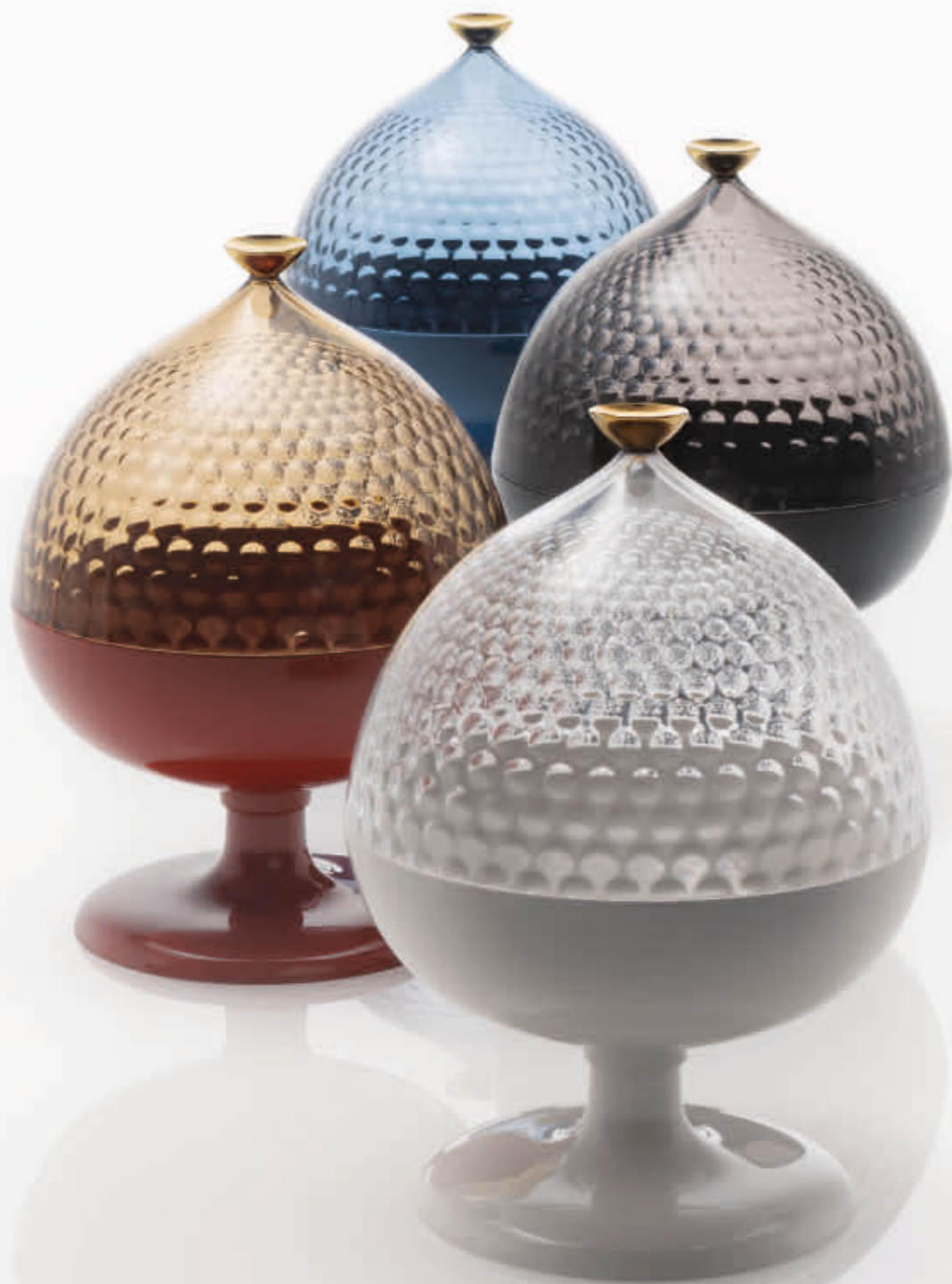
PUMO centrepiece des. F. Novembre