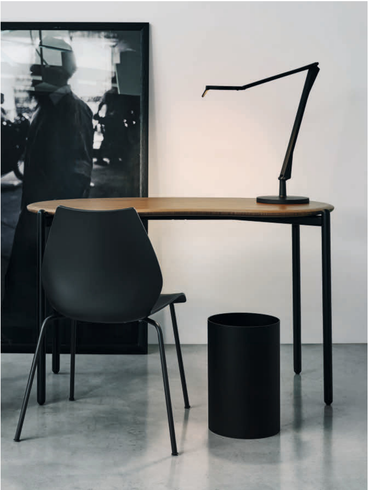
MAUI chair des. V. Magistretti