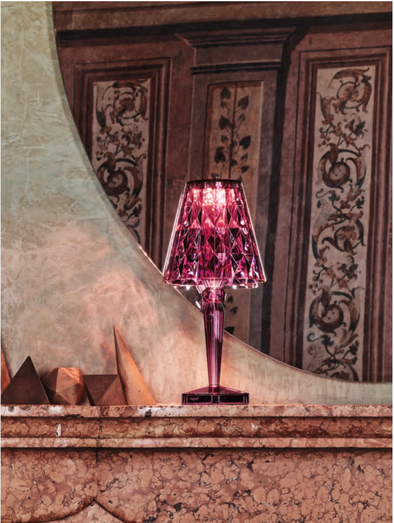
BIG BATTERY table lamp des. F. Laviani