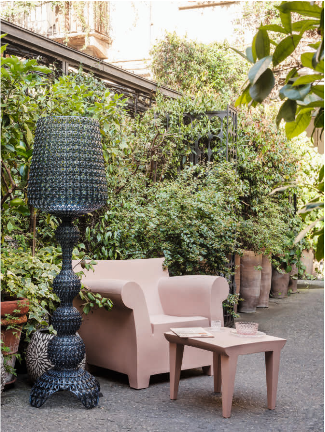
BUBBLE CLUB armchair des. P. Starck