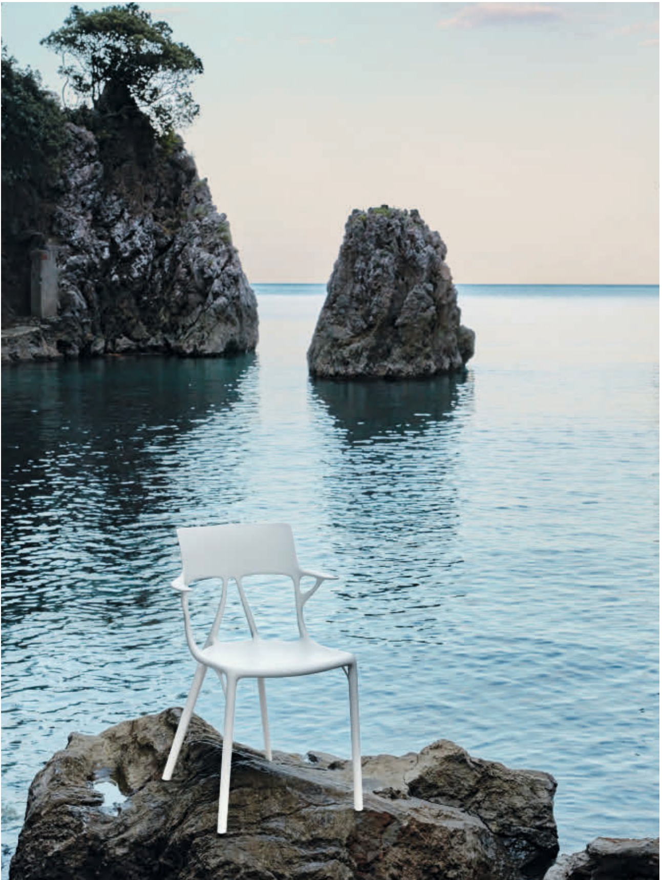
A.I. chair des. P. Starck