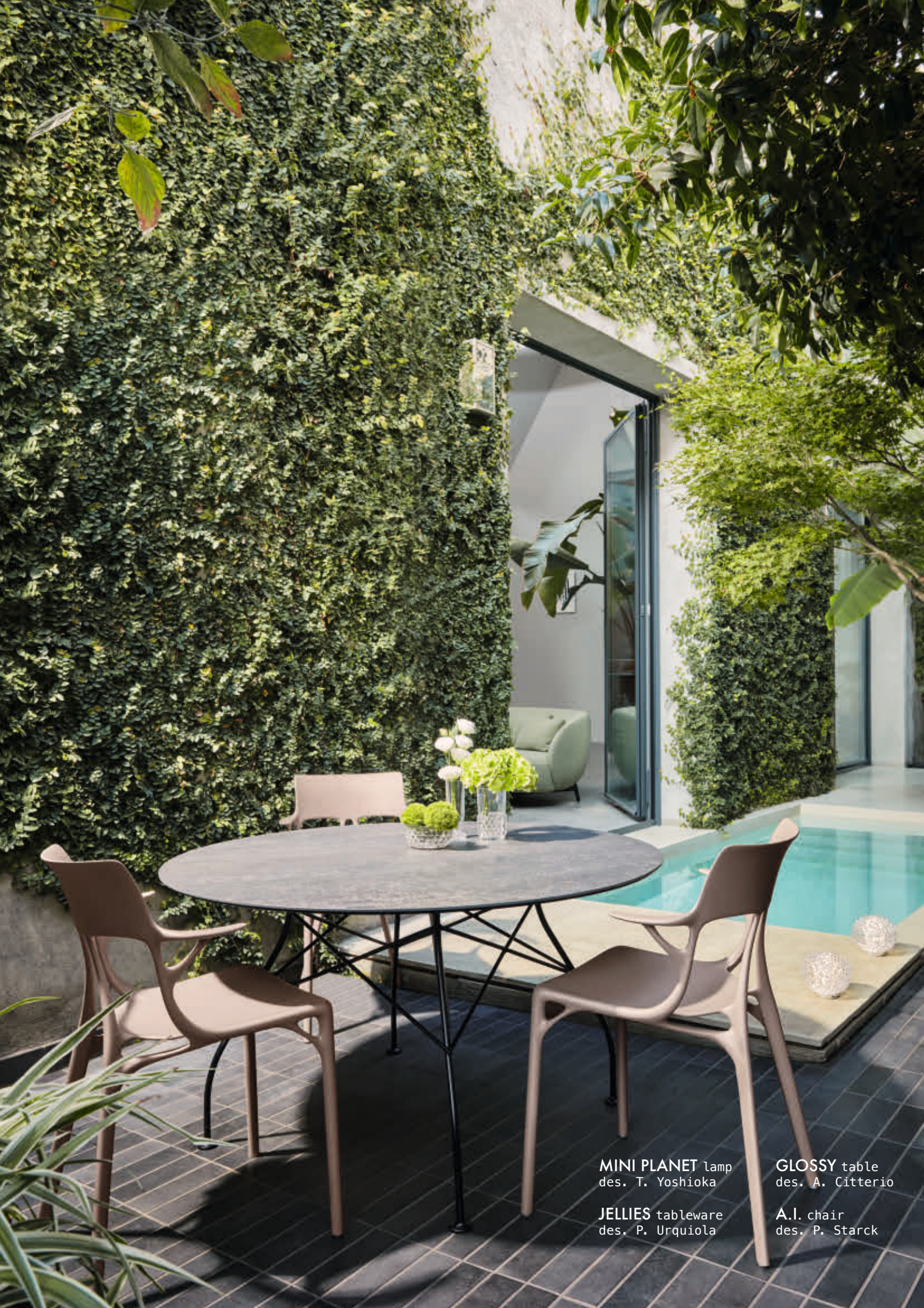
MINI PLANET lamp des. T. Yoshioka