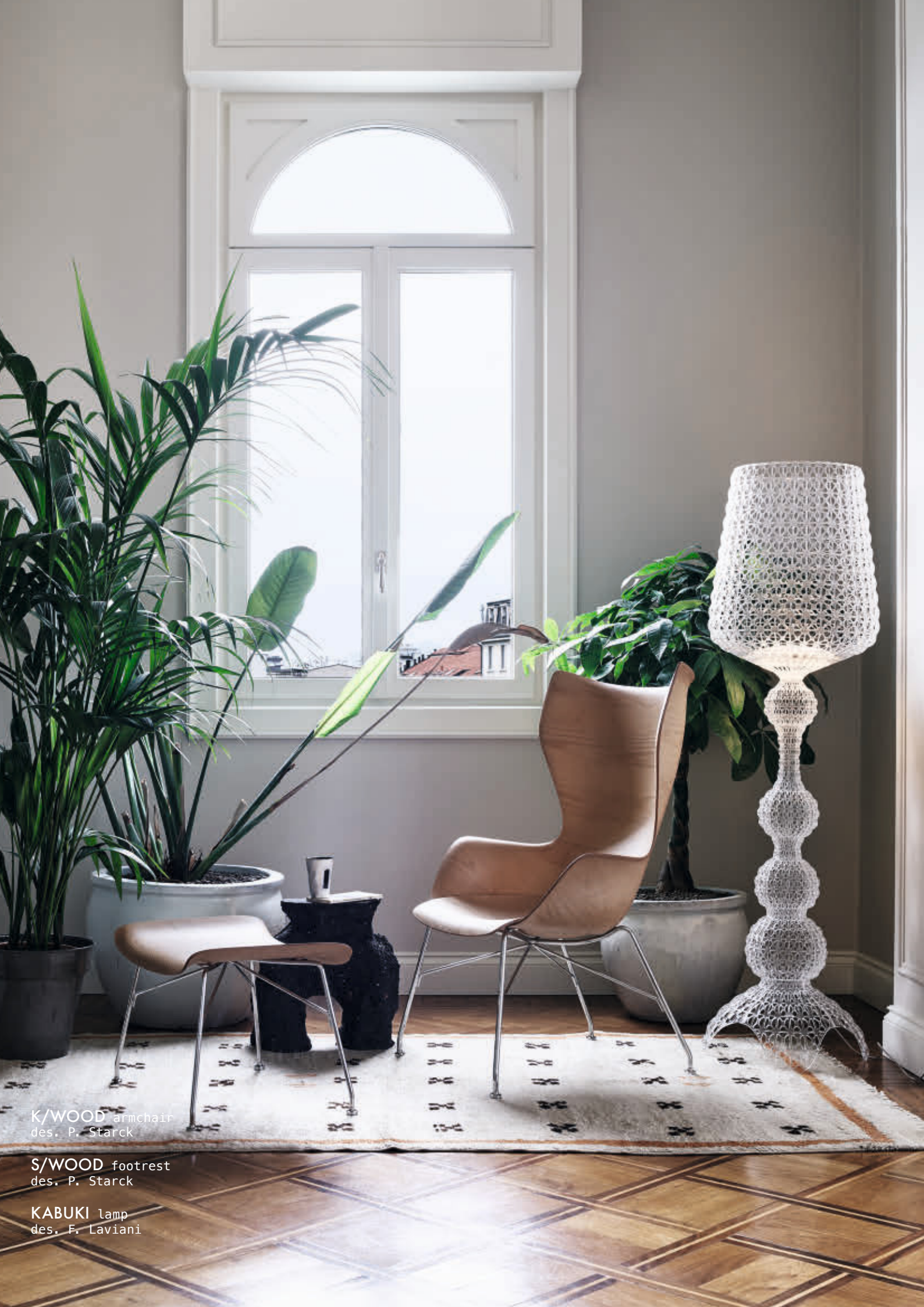
K/WOOD armchair des. P. Starck