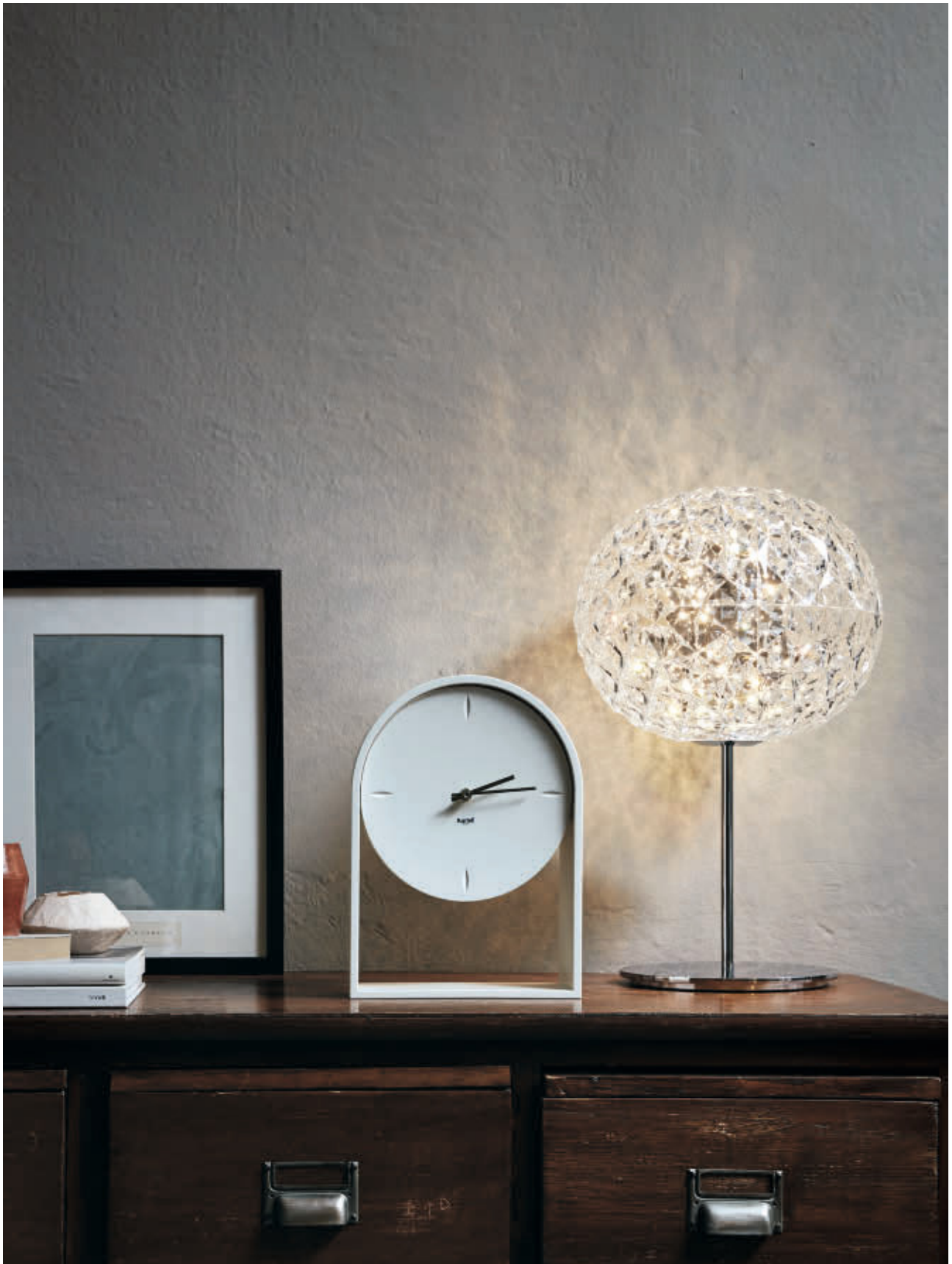
AIR DU TEMPS clock des. E. Quittlet