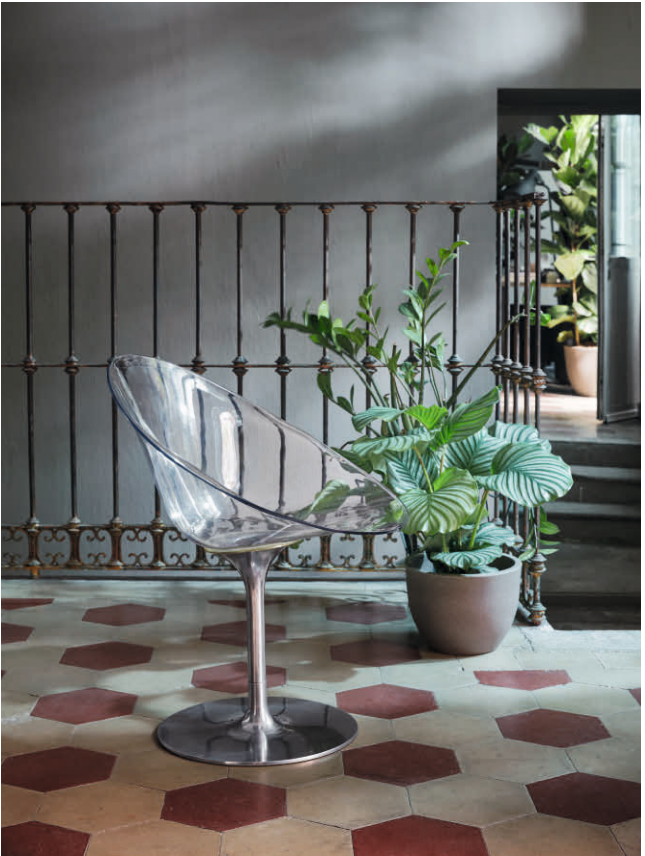
ERO|S| chair des. P. Starck