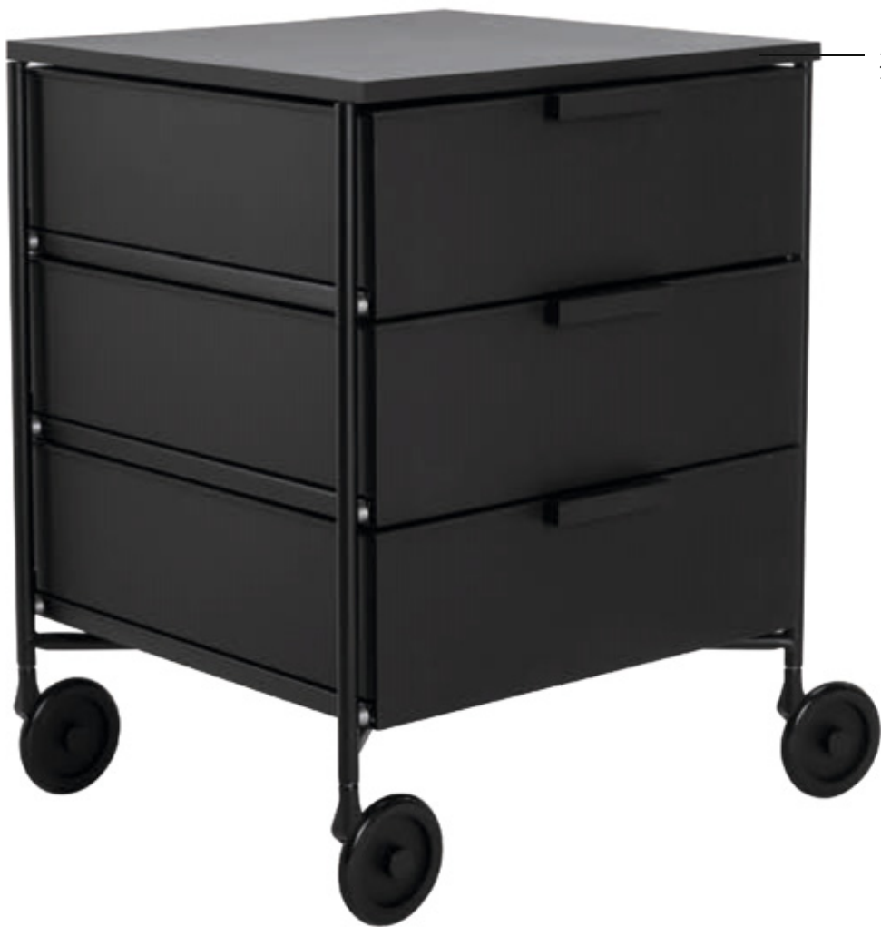
MOBIL 1994 des. A. Citterio with O. Löw