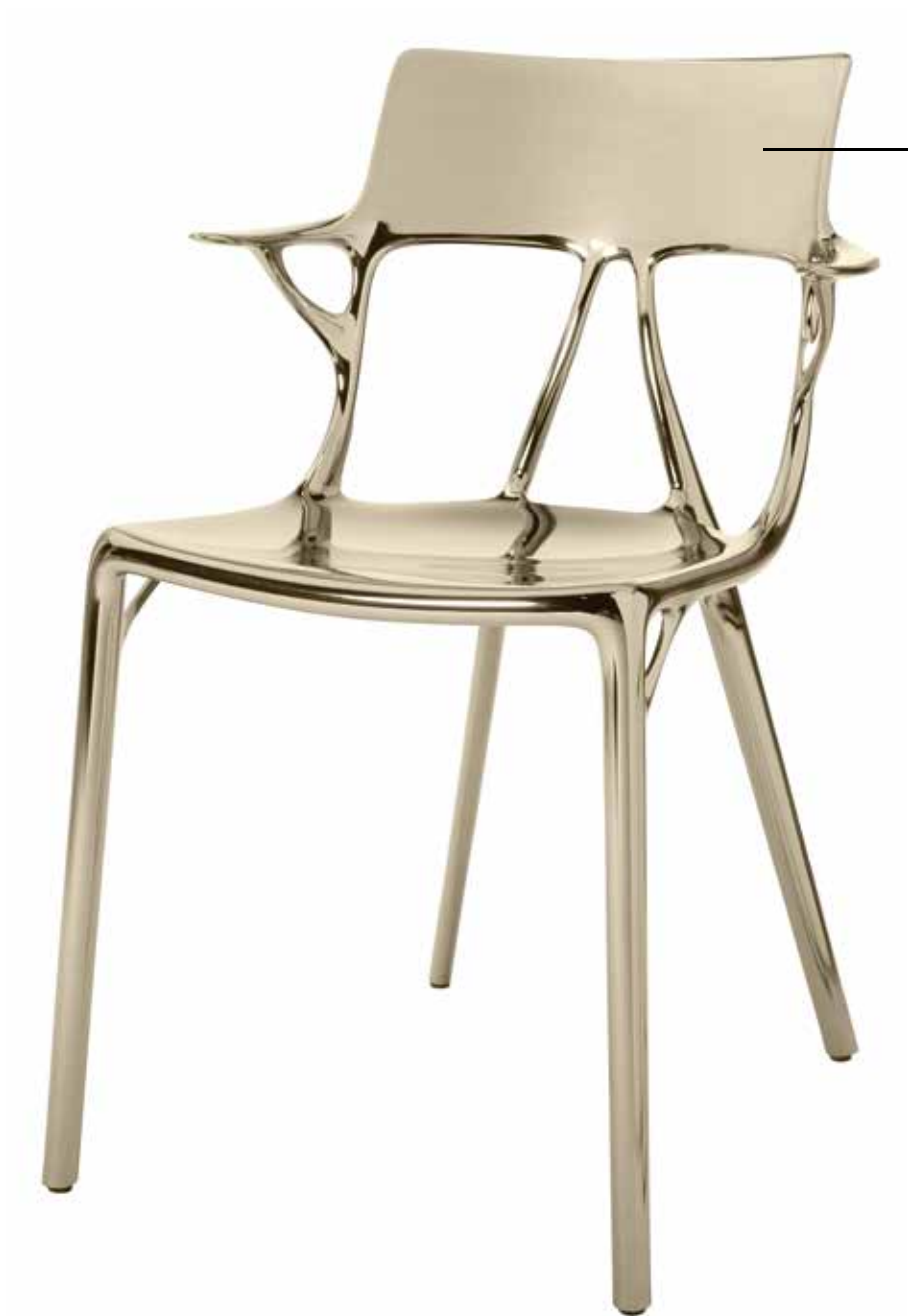
A.I. 2019 des. P. Starck