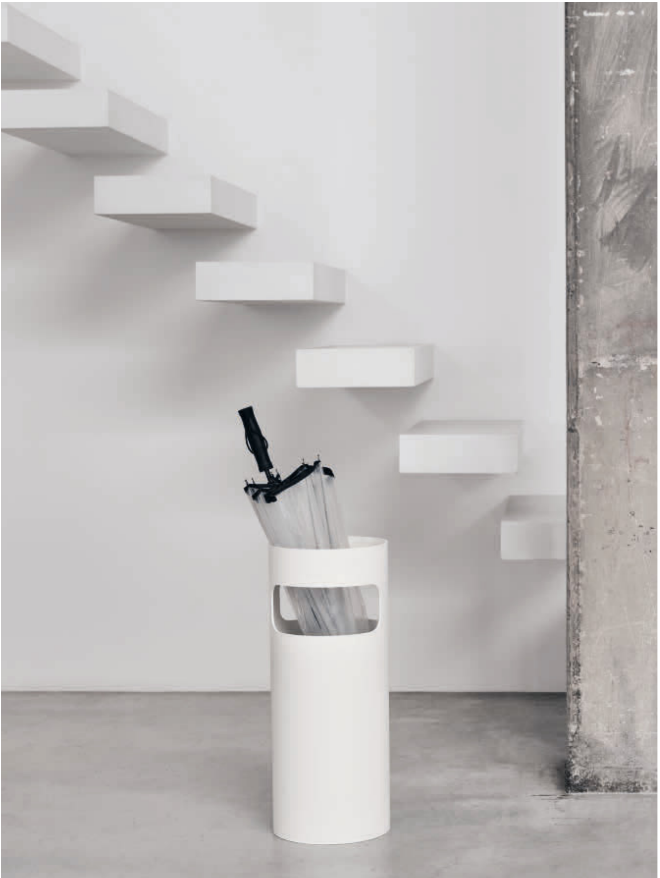
UMBRELLA STAND des. G. Colombini