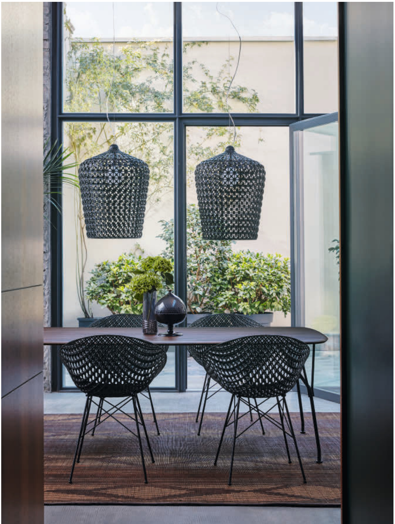
VISCOUNT OF WOOD table des. P. Starck