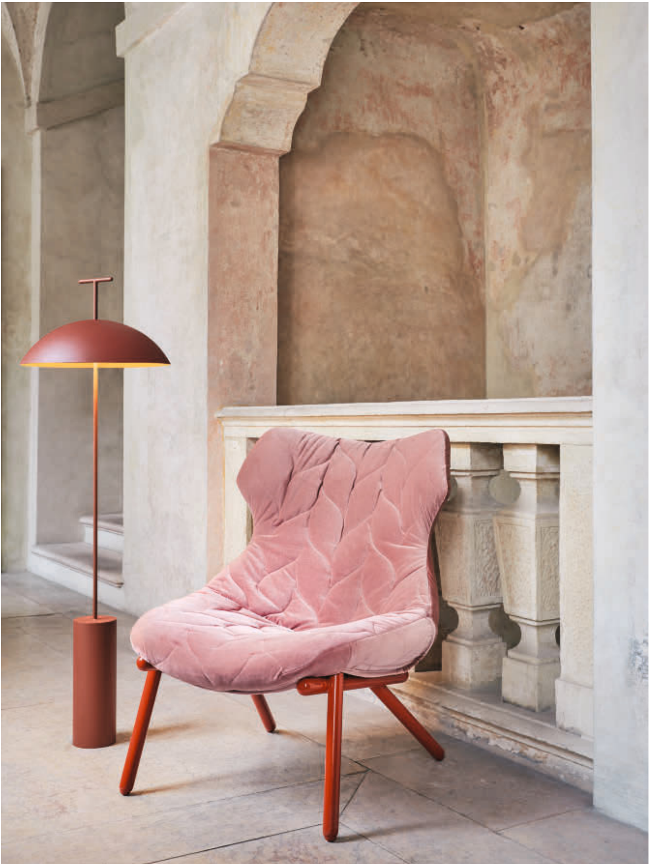
GEEN-A lamp des. F. Laviani