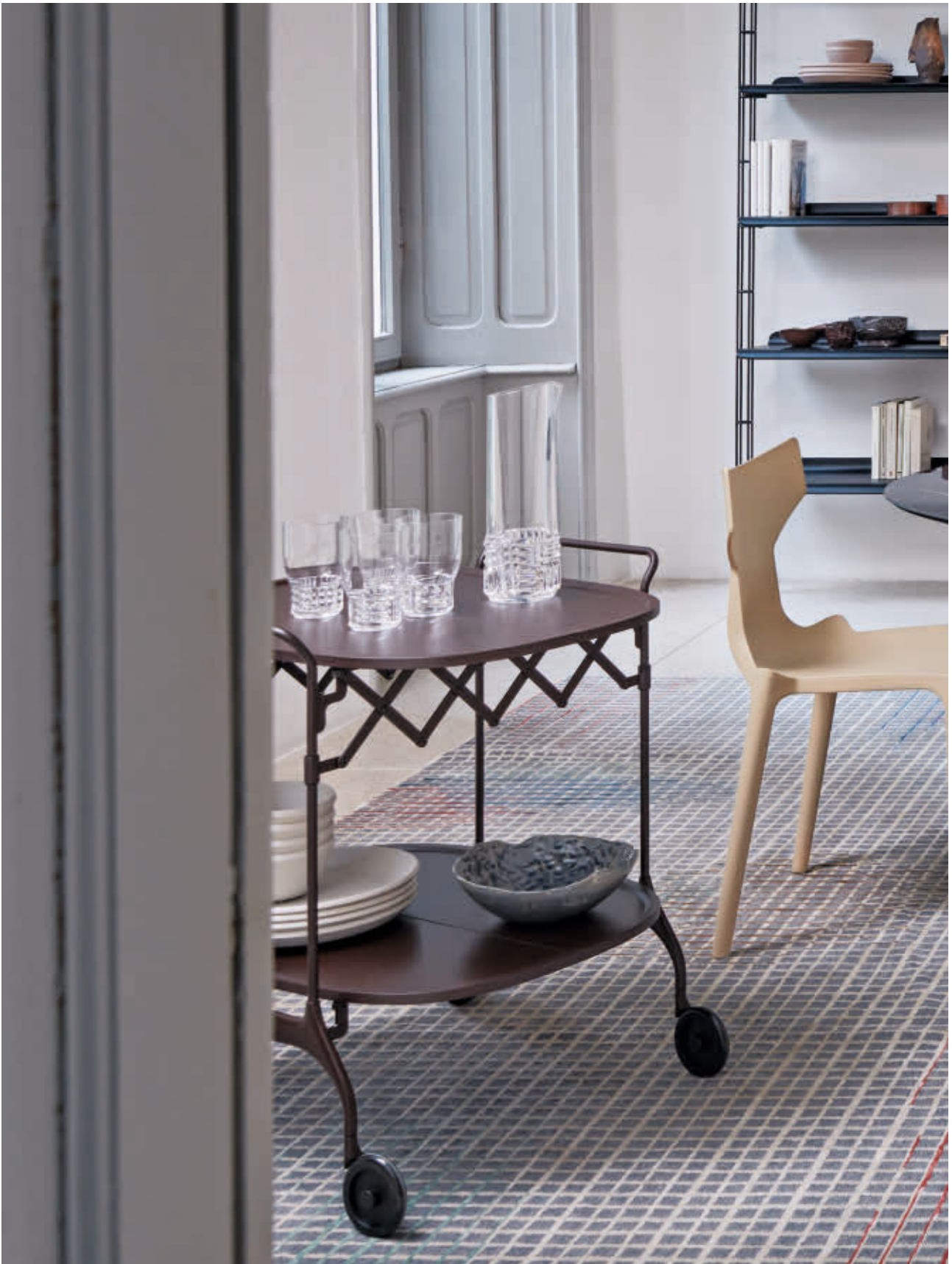
GASTONE folding cart des. A. Citterio