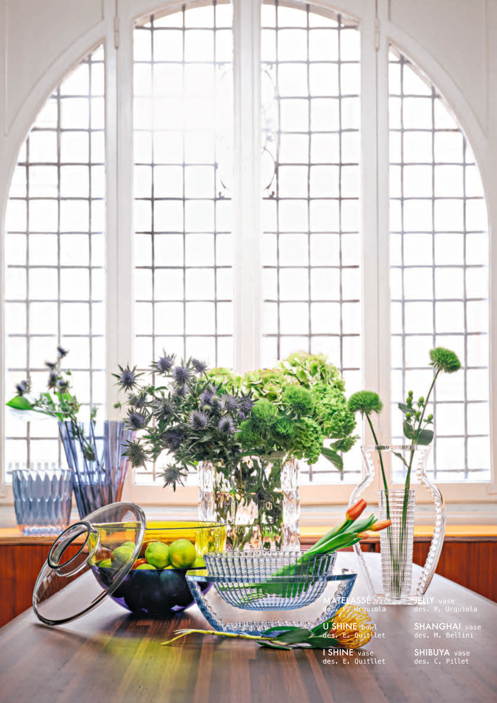
MATELASSÉ vase des. P. Urquiola