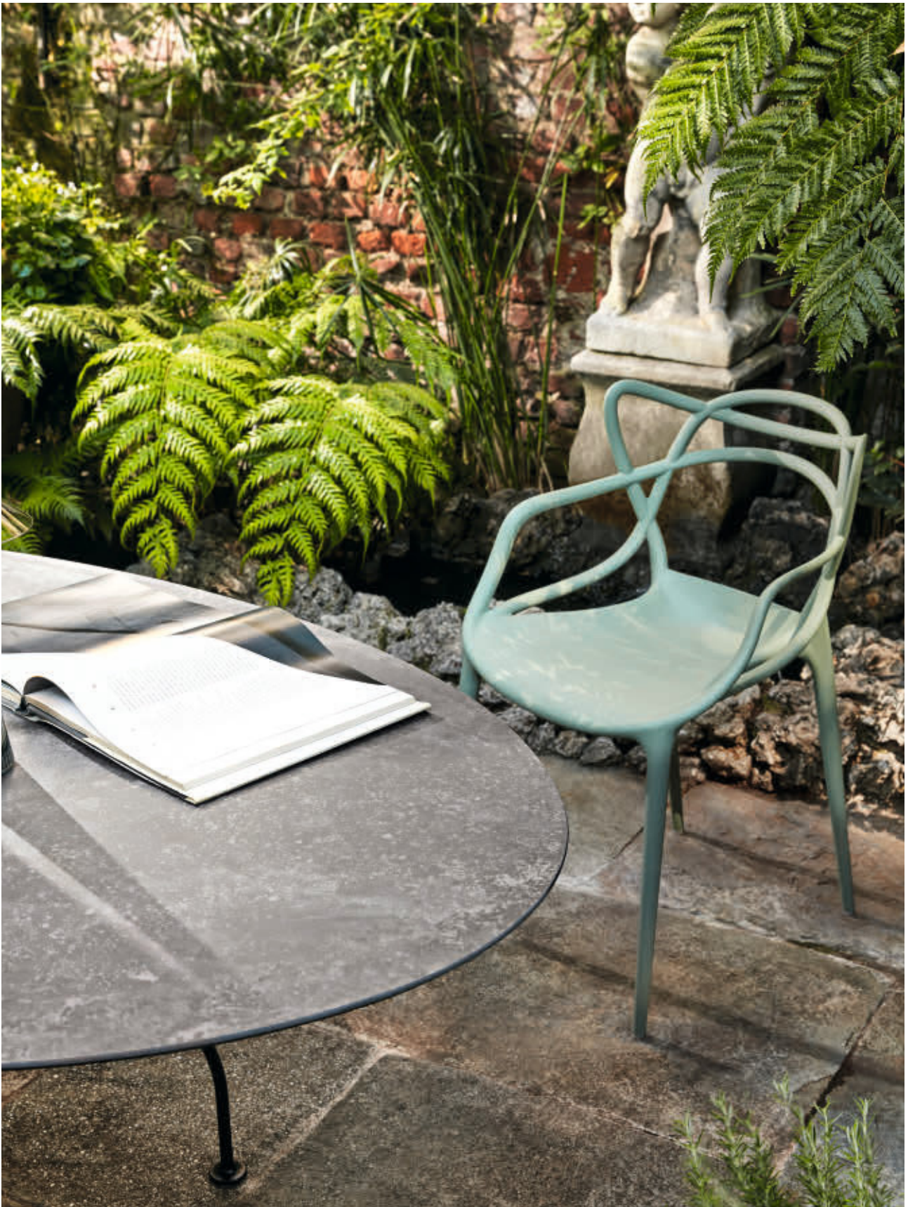
GLOSSY table des. A. Citterio