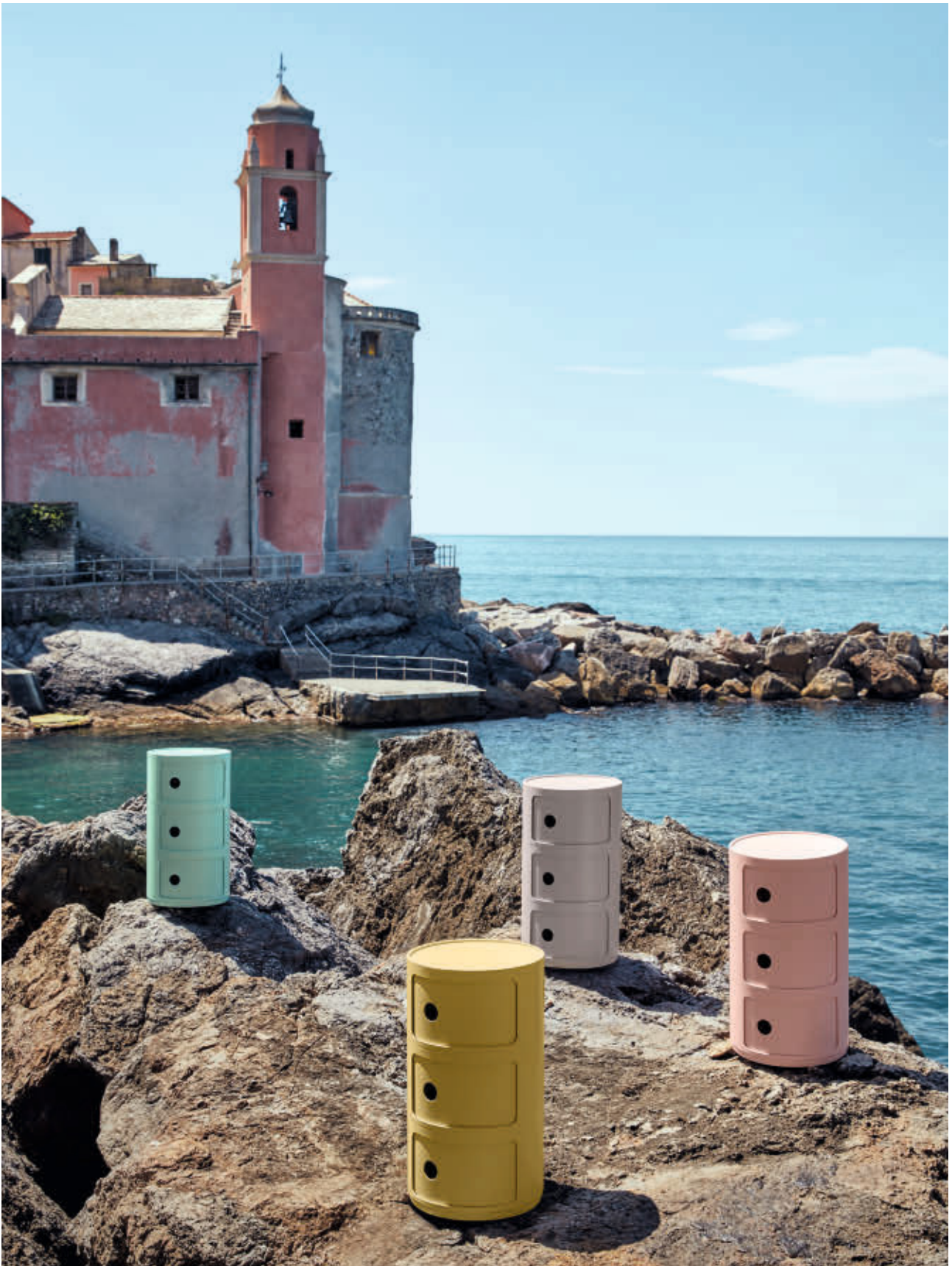
COMONIBILI BIO container des. A. C. Ferrieri