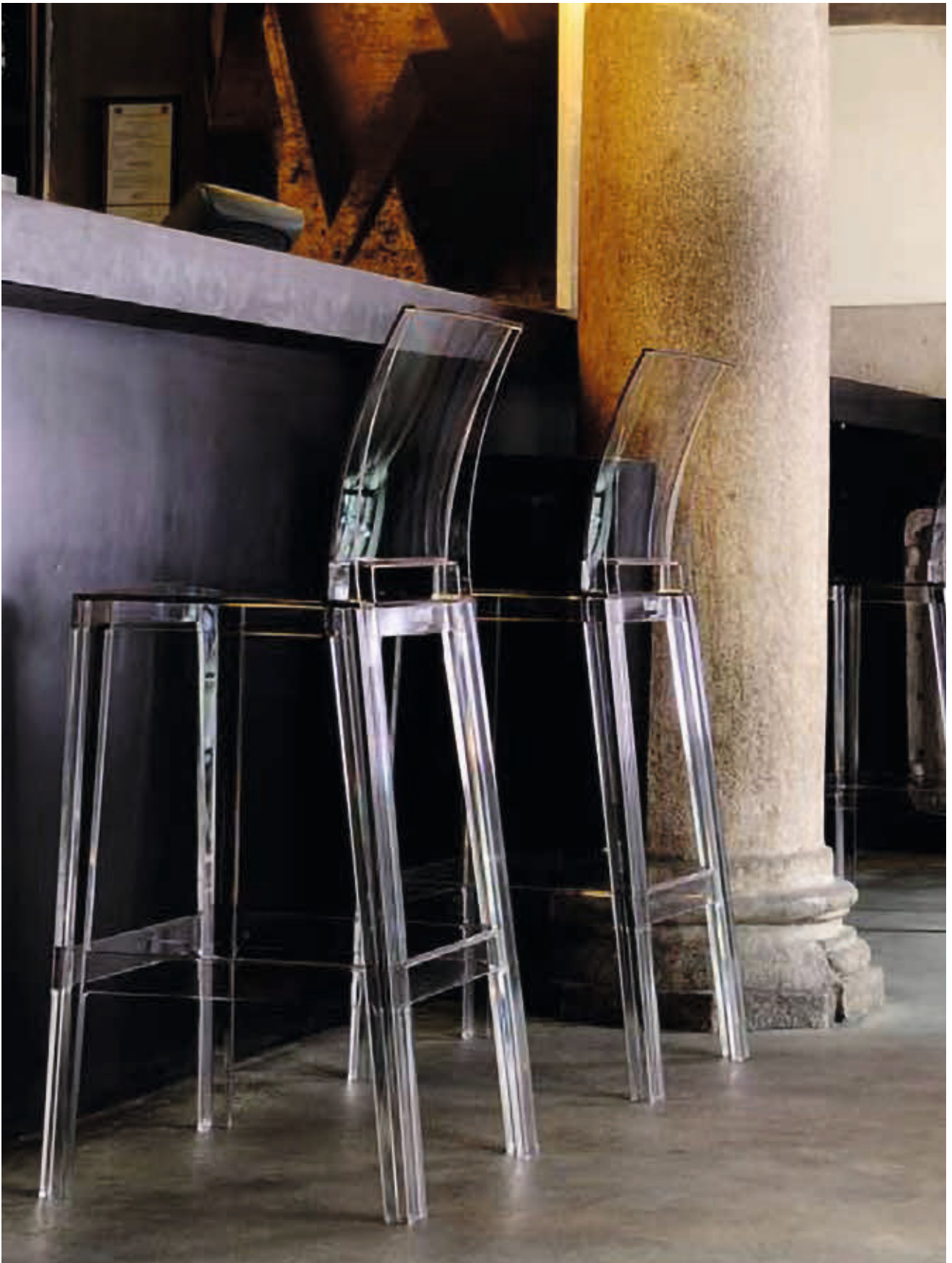
ONE MORE PLEASE stool des. P. Starck