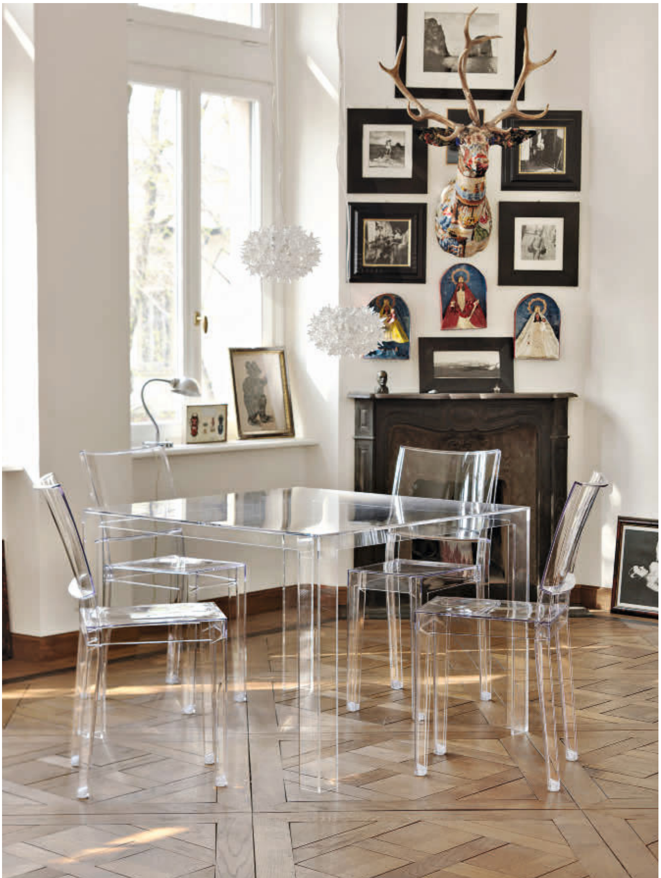
INVISIBLE TABLE table des. T. Yoshioka