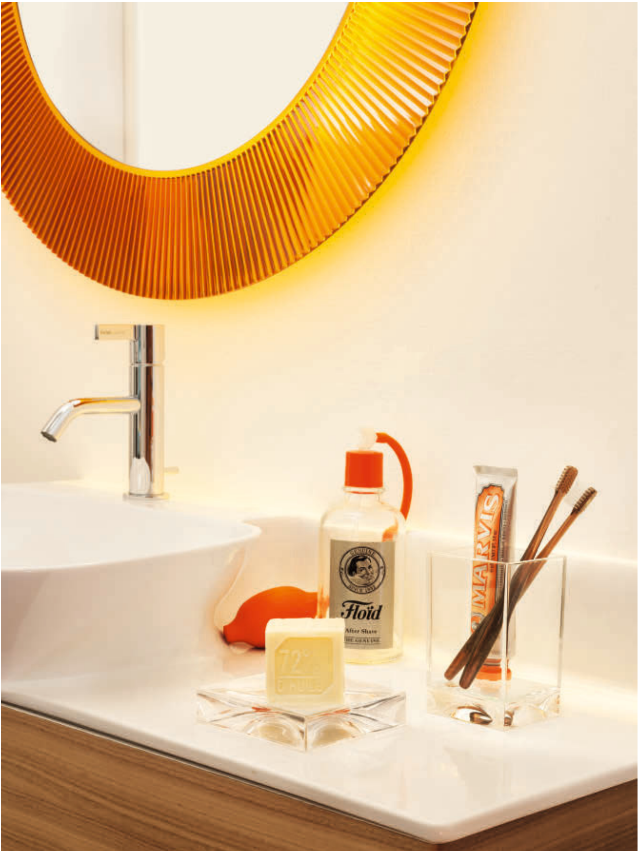
ALL SAINTS mirror des. L.+R. Palomba