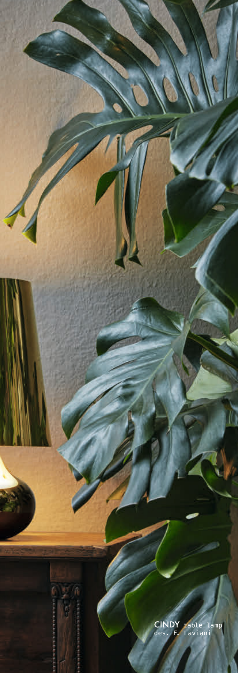
CINDY table lamp des. F. Laviani