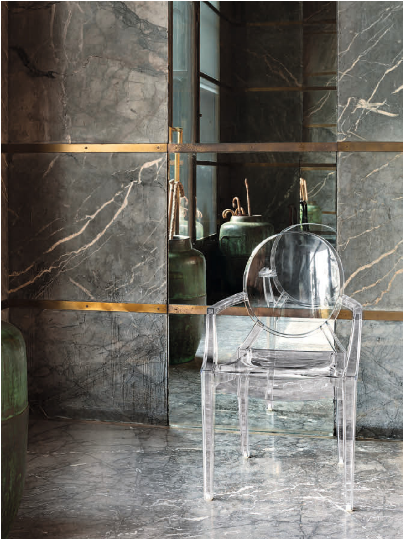
LOUIS GHOST chair des. P. Starck