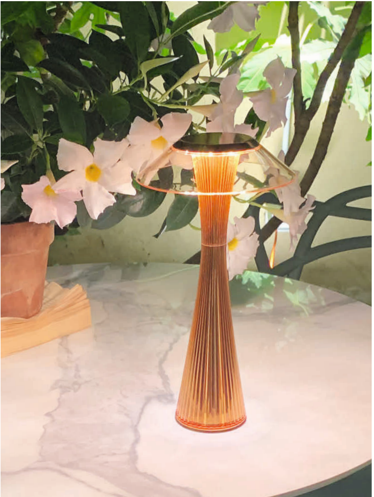
SPACE table lamp des. A. Tihany