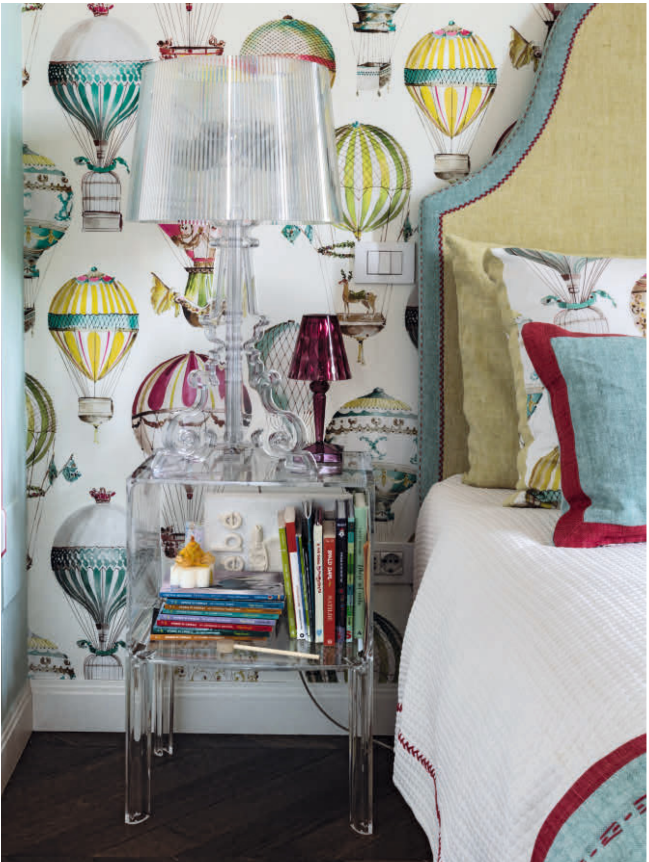
BOURGIE lamp des. F. Laviani