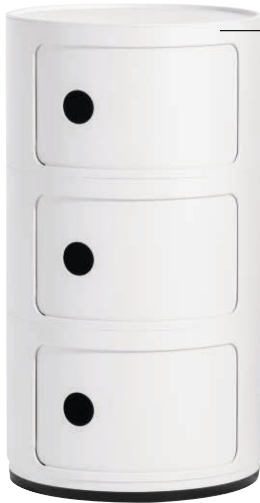
COMPONIBILI 1969 des. A. Castelli Ferrieri