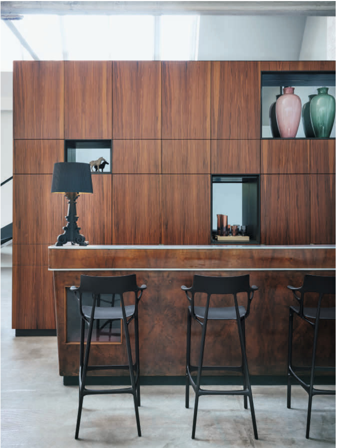
BOURGIE MAT lamp des. F. Laviani