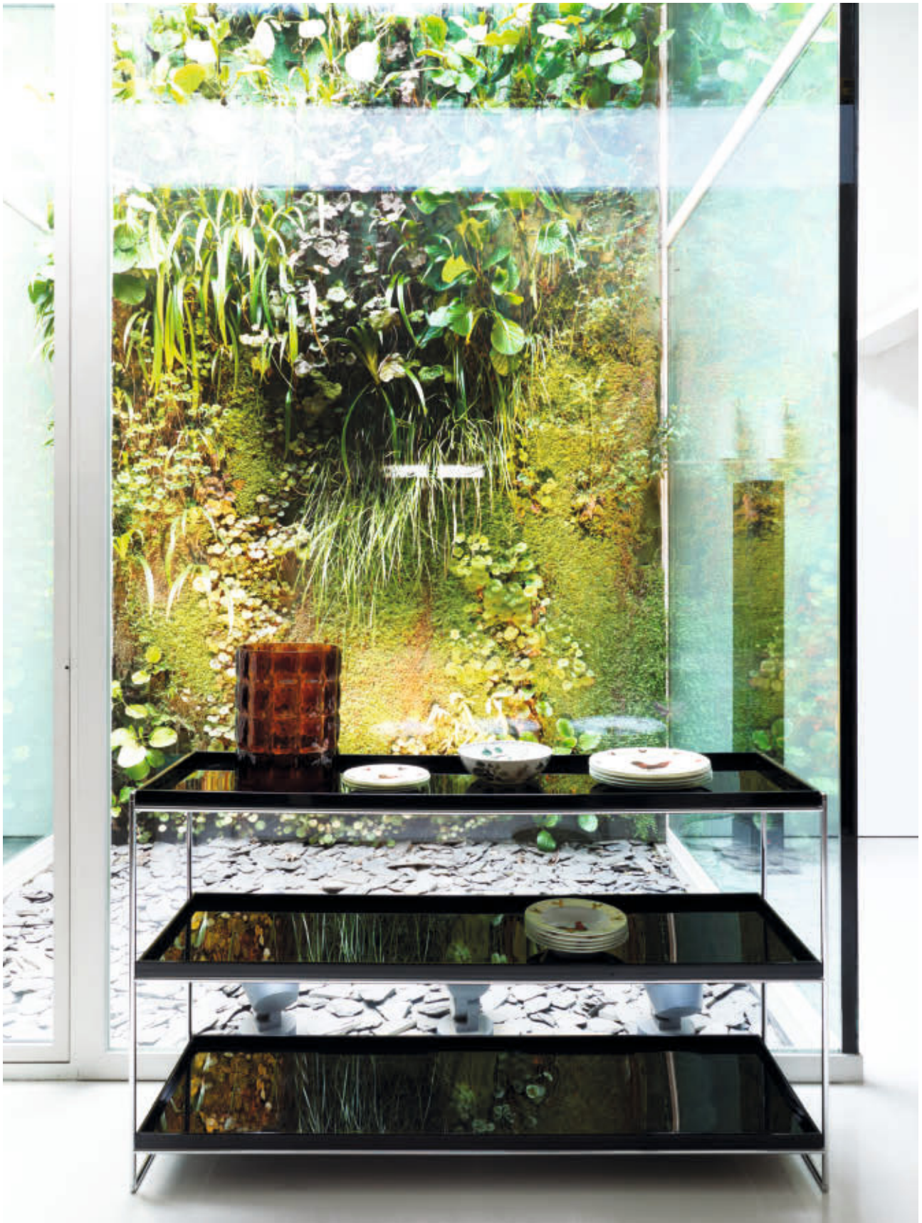
TRAYS bookcase/shelf des. P. Lissoni