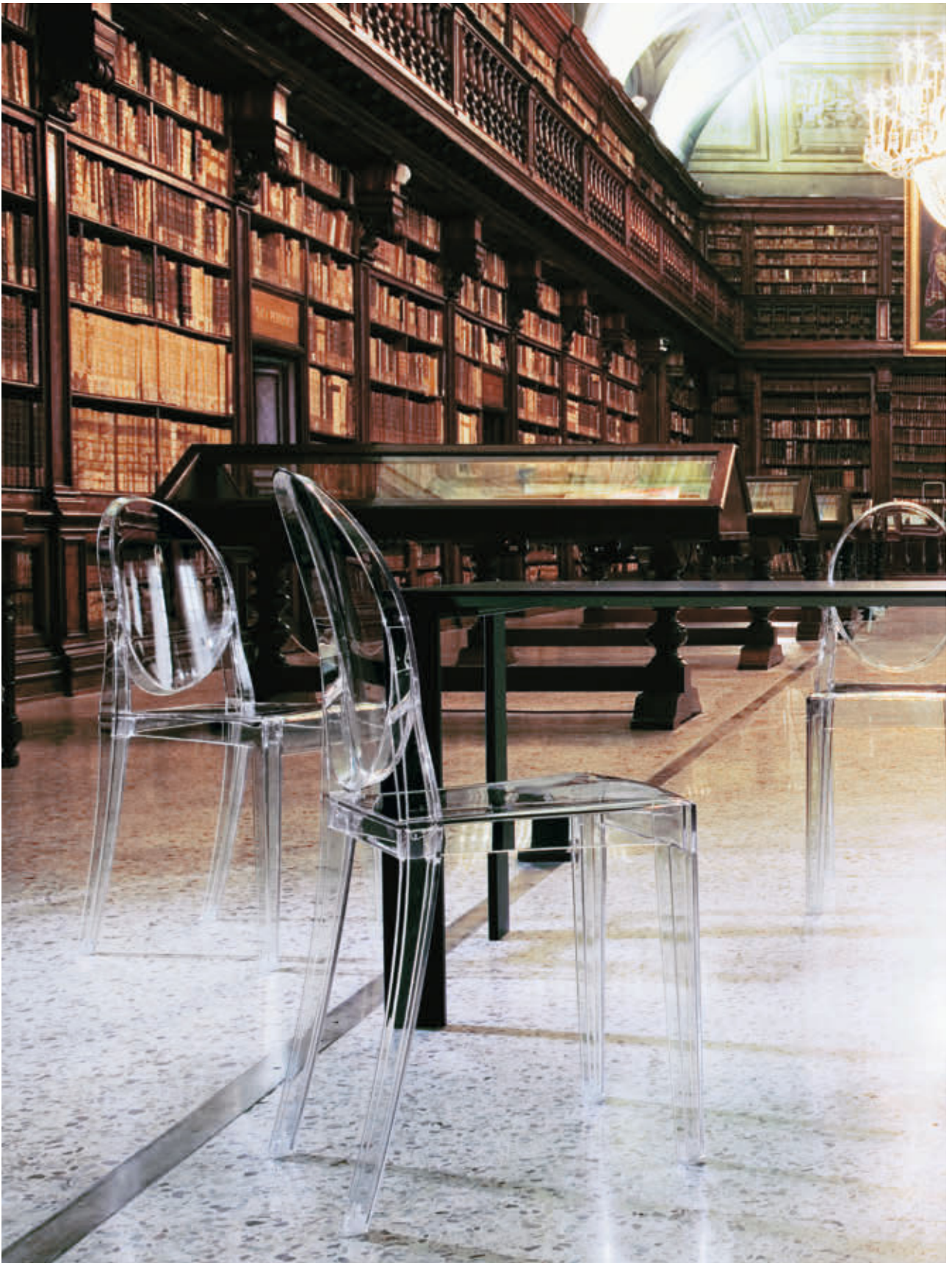
VICTORIA GHOST chair des. P. Starck