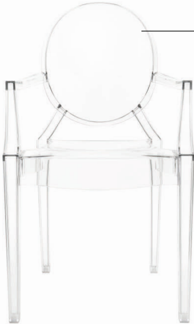
LOUIS GHOST 2002 des. P. Starck