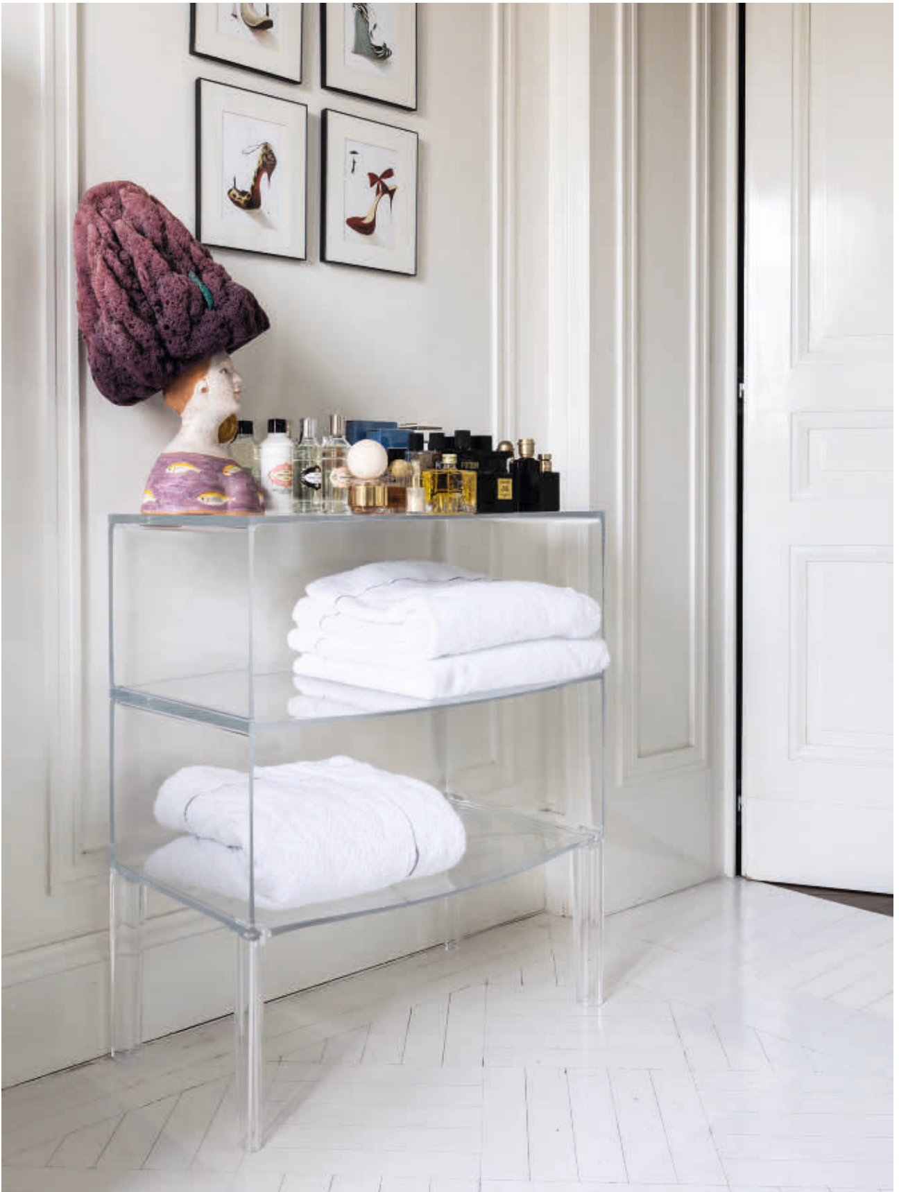
GHOST BUSTER dresser des. P. Starck