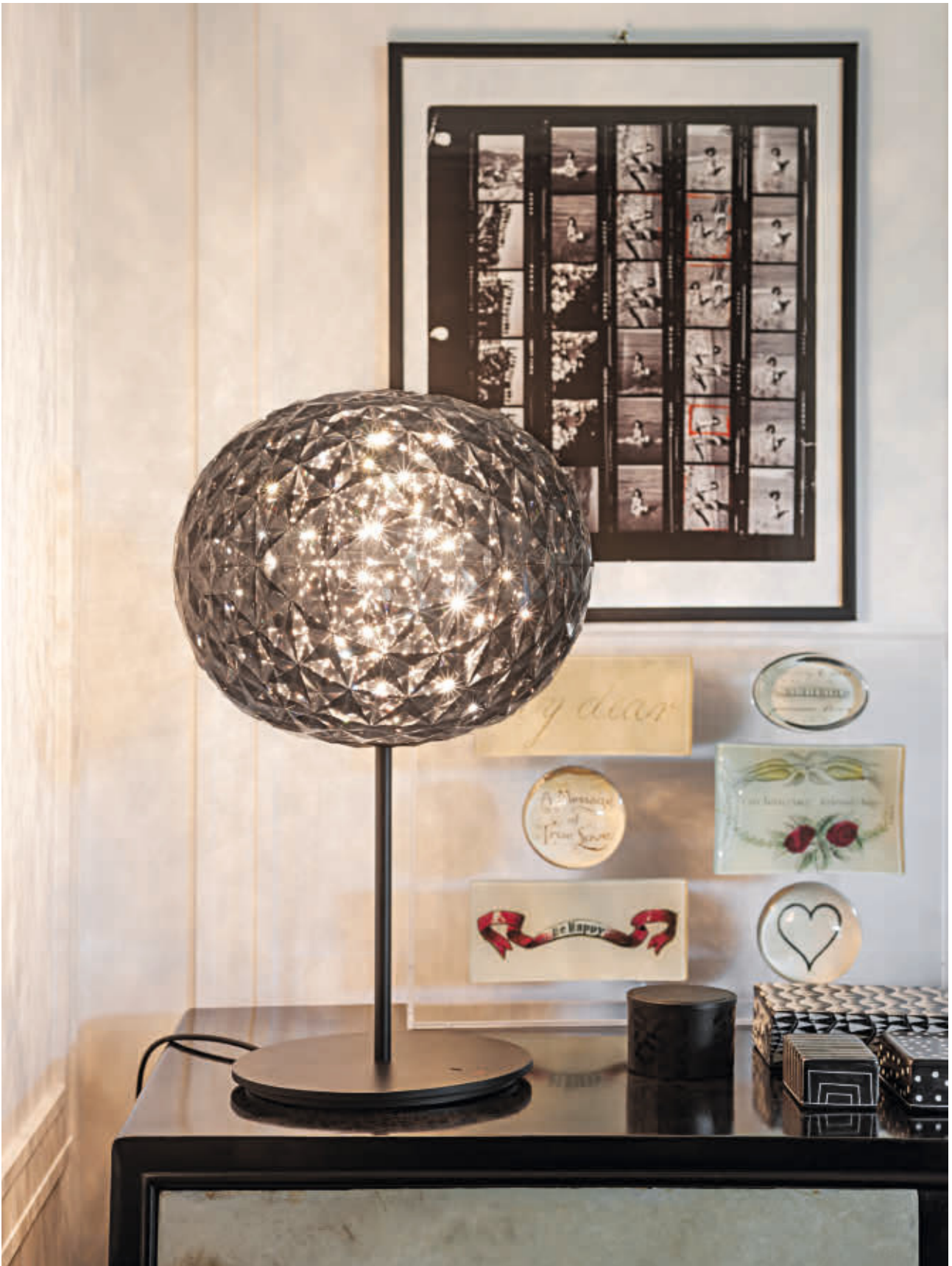
PLANET table lamp des. T. Yoshioka