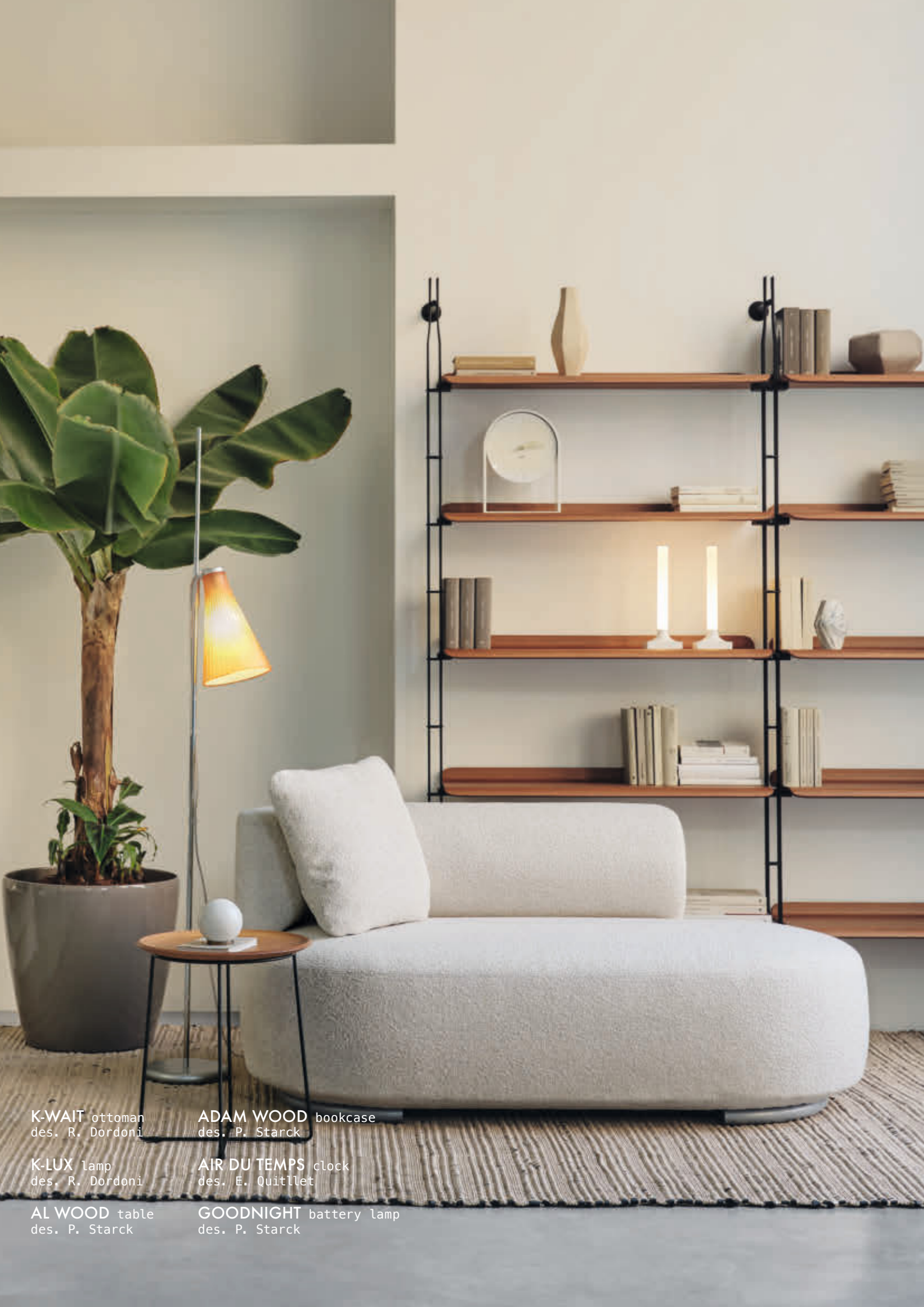
K-WAIT ottoman des. R. Dordoni