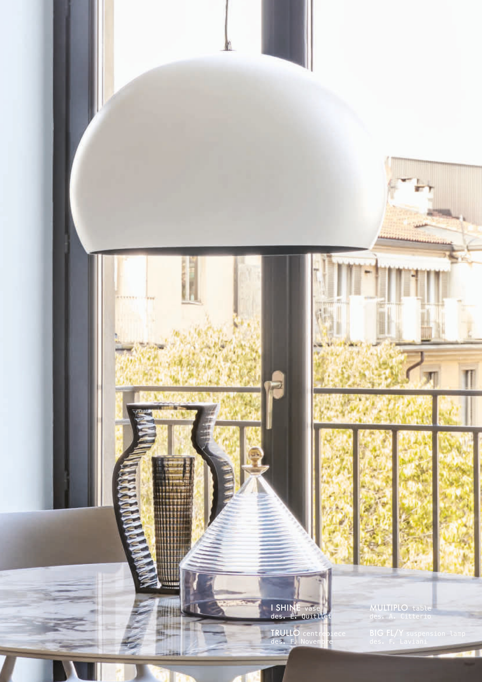
I SHINE vase des. E. Quillet