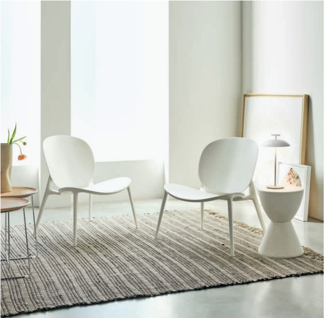
BE BOP chair des. L.+R. Palomba