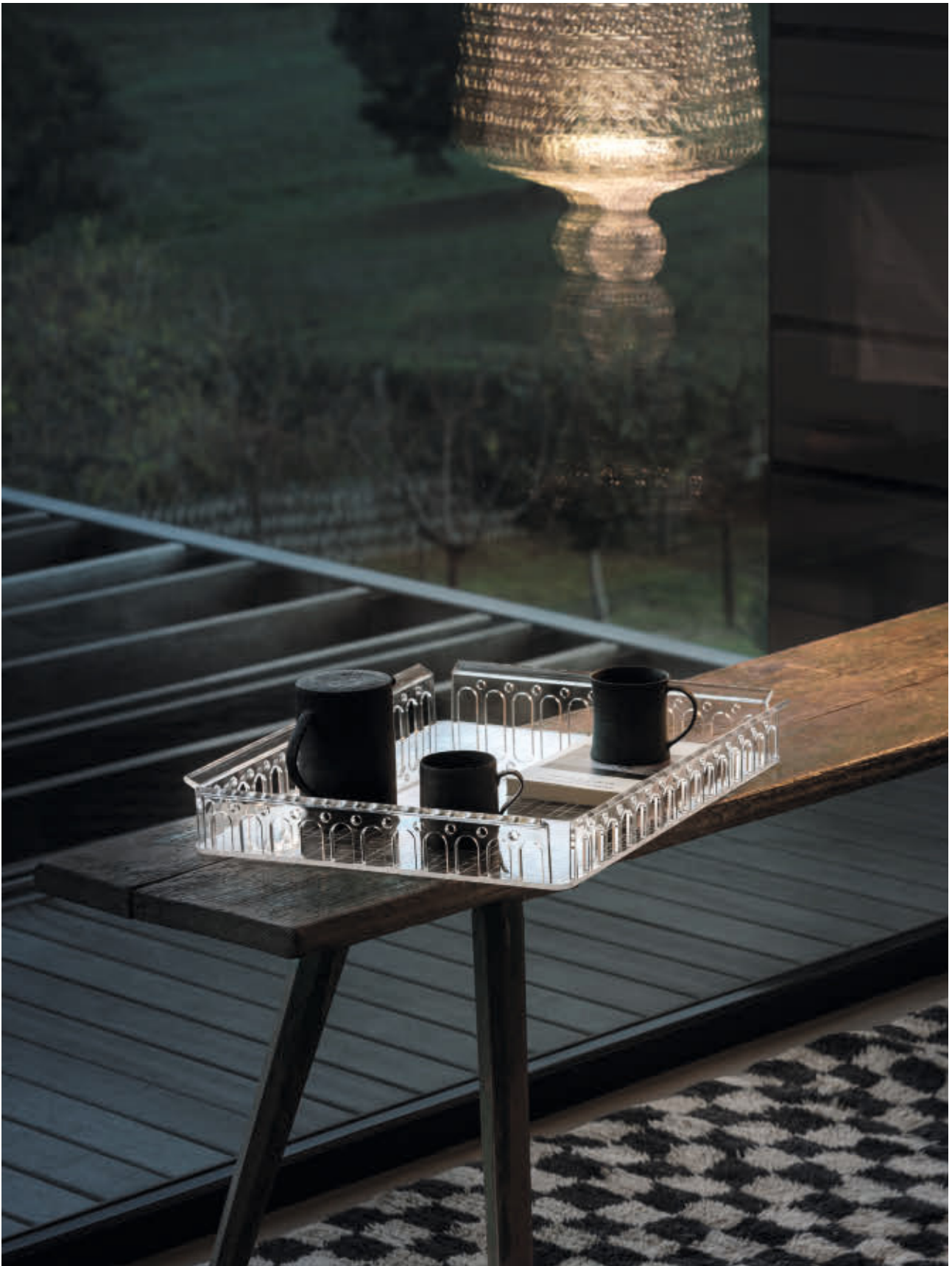
PIAZZA tray des. F. Novembre