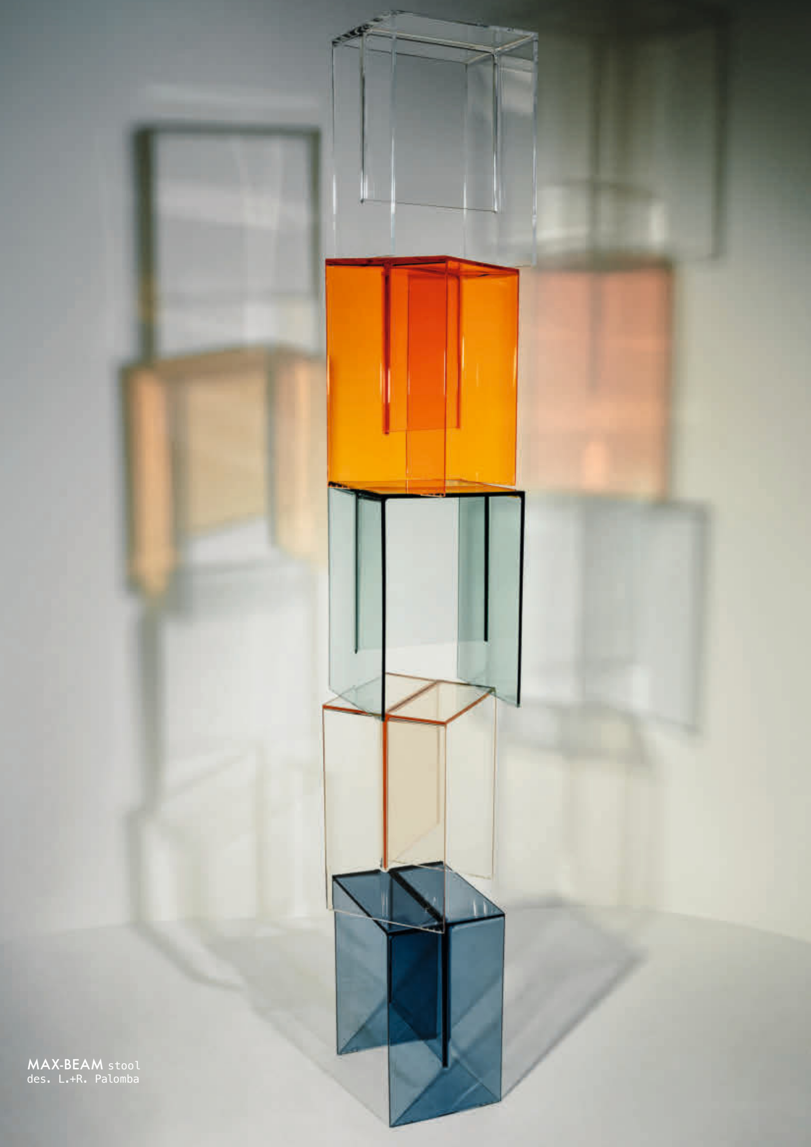
MAX-BEAM stool des. L.+R. Palomba