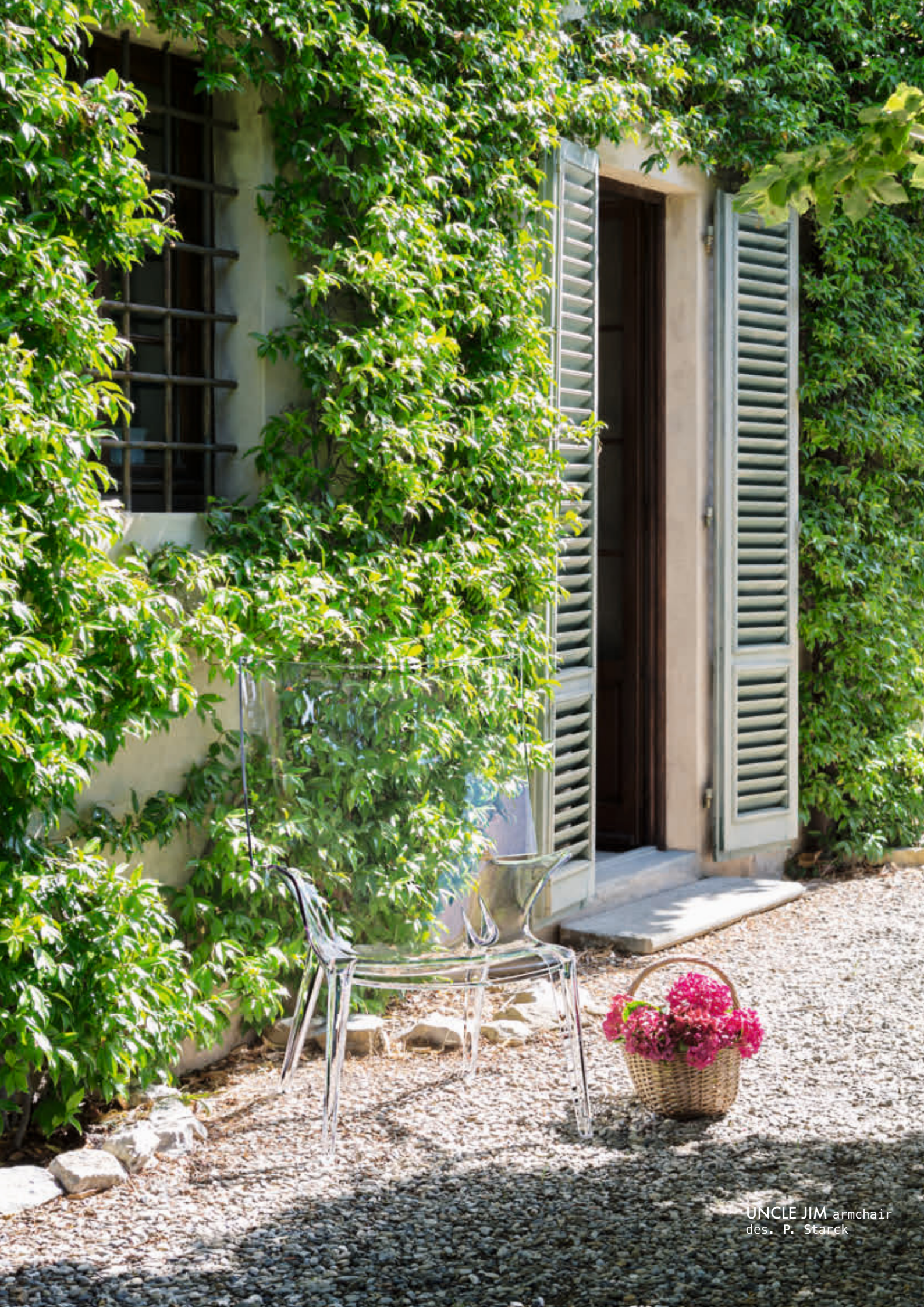
UNCLE JIM armchair dés. P. Starck