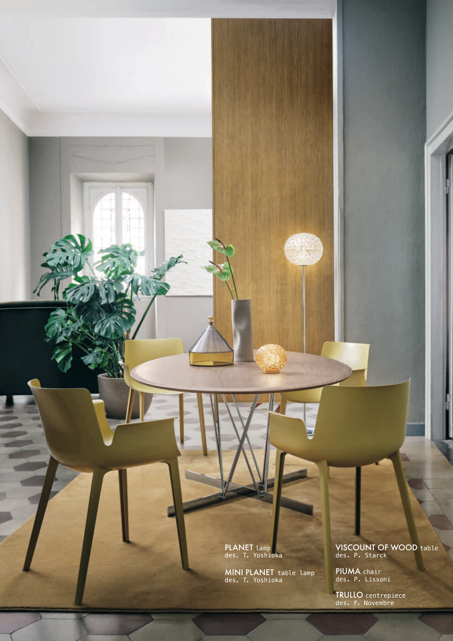
PLANET lamp des. T. Yoshioka