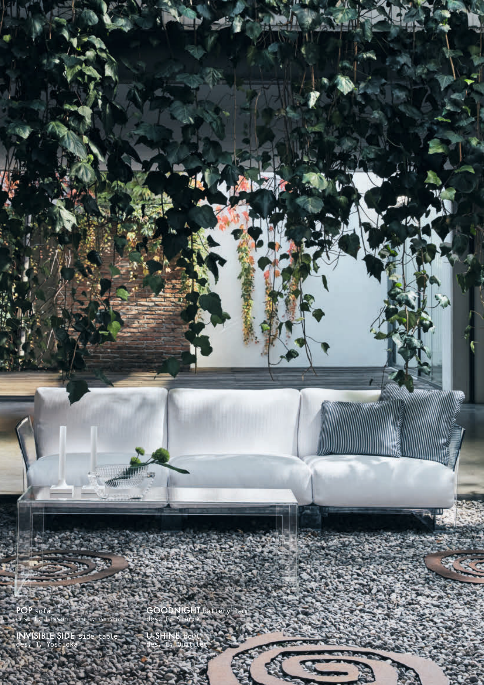
POP sofa des. P. Lissoni with C. Tamborini