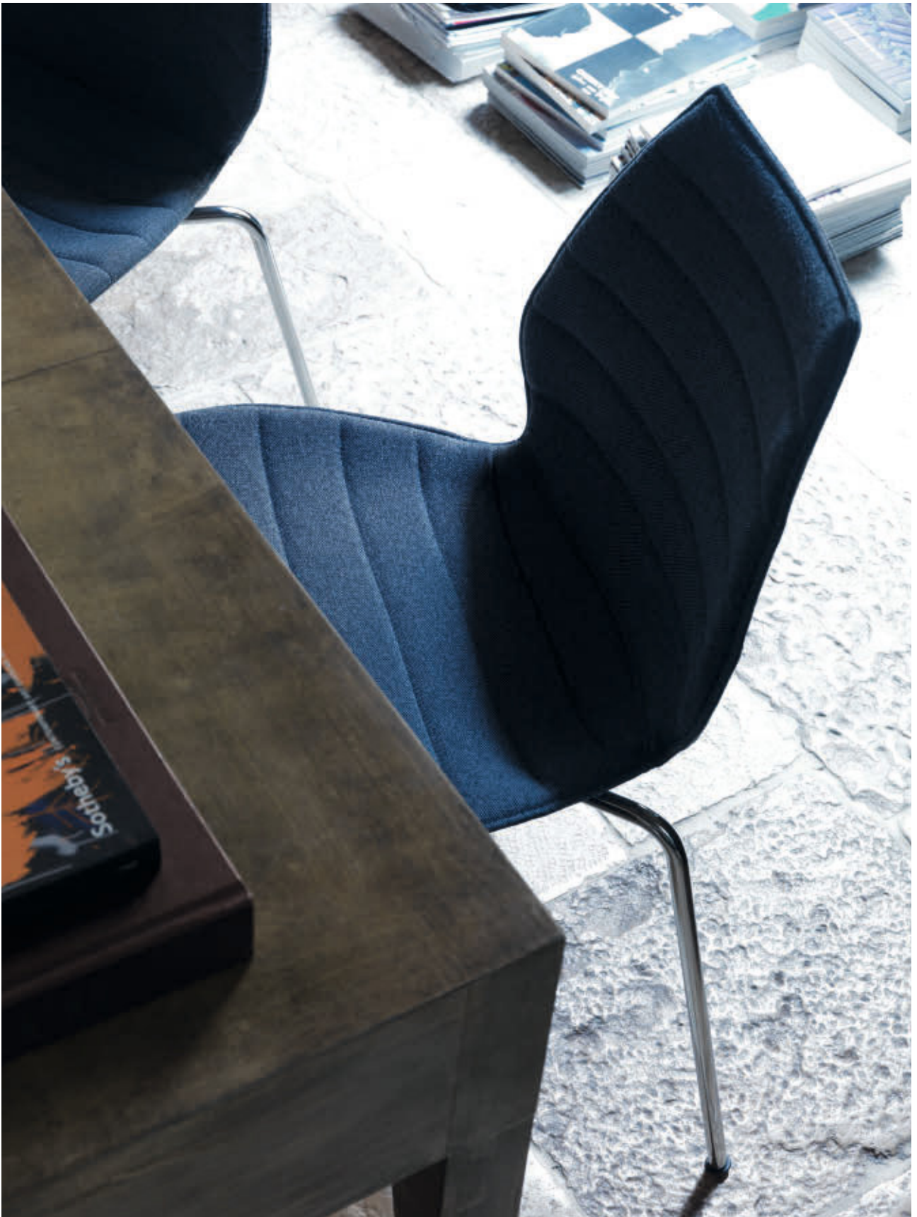
MAUI SOFT chair des. V. Magistretti