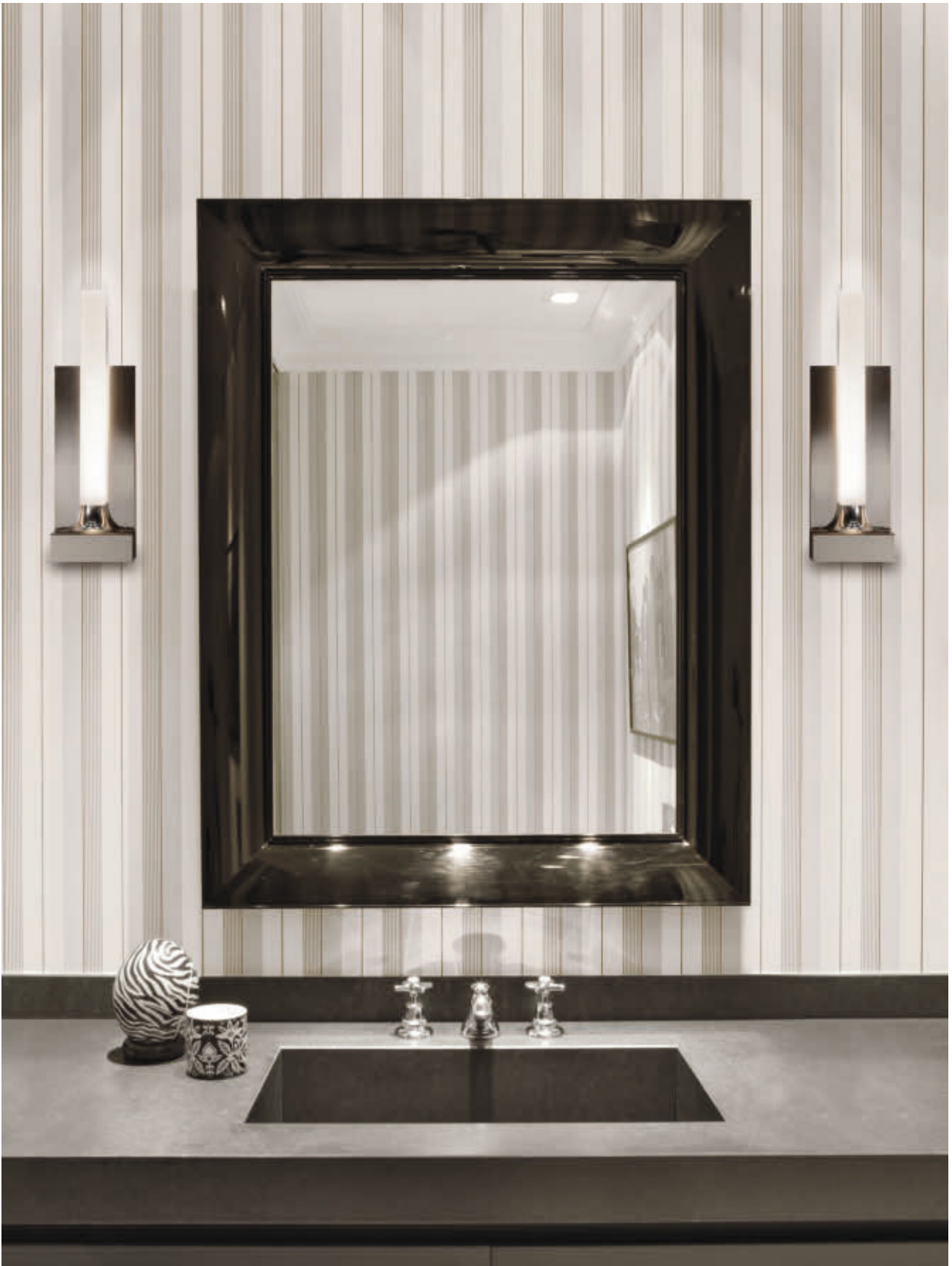
GOODNIGHT wall lamp des. P. Starck