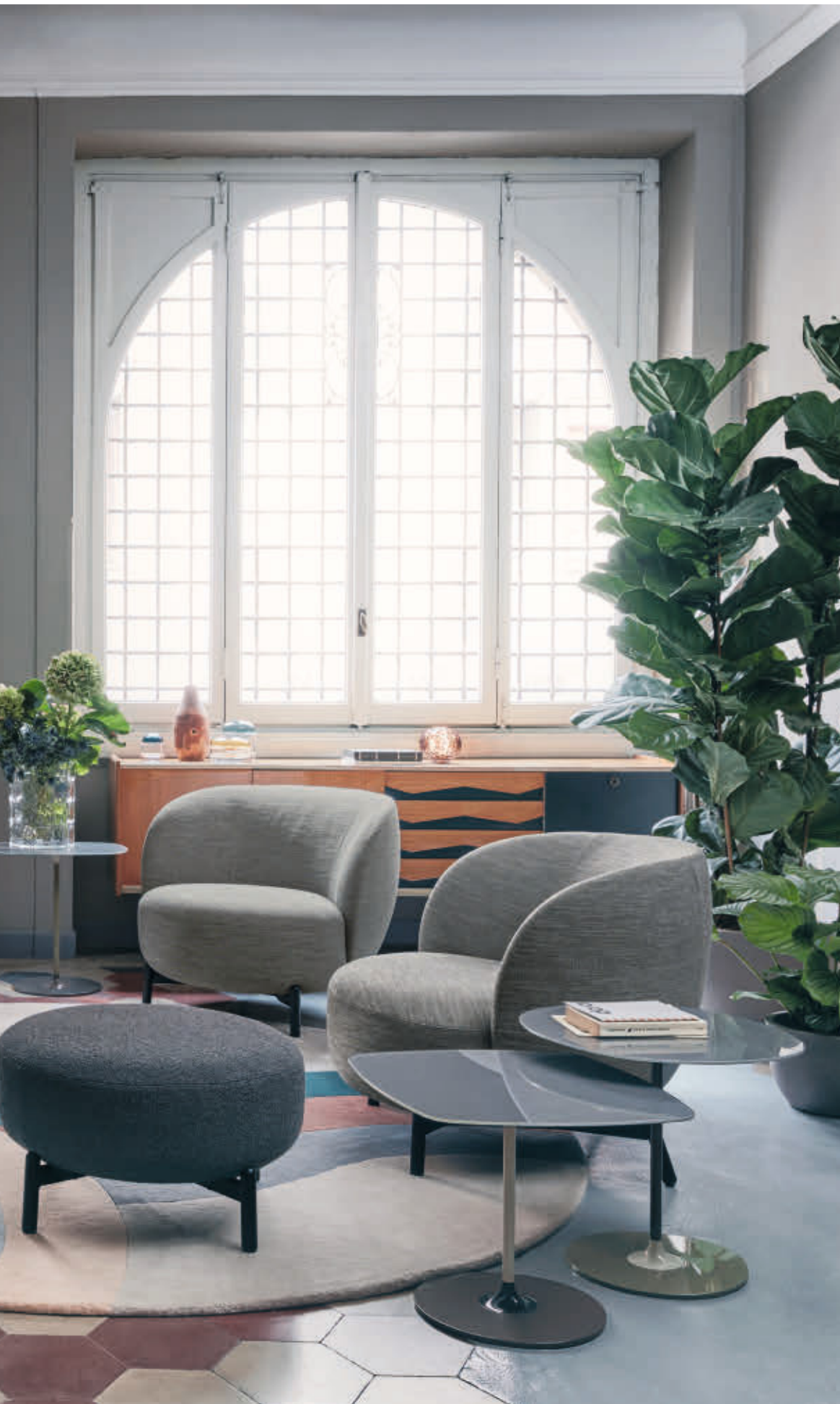
LUNAM sofa, pouf, armchair des. P. Urquiola