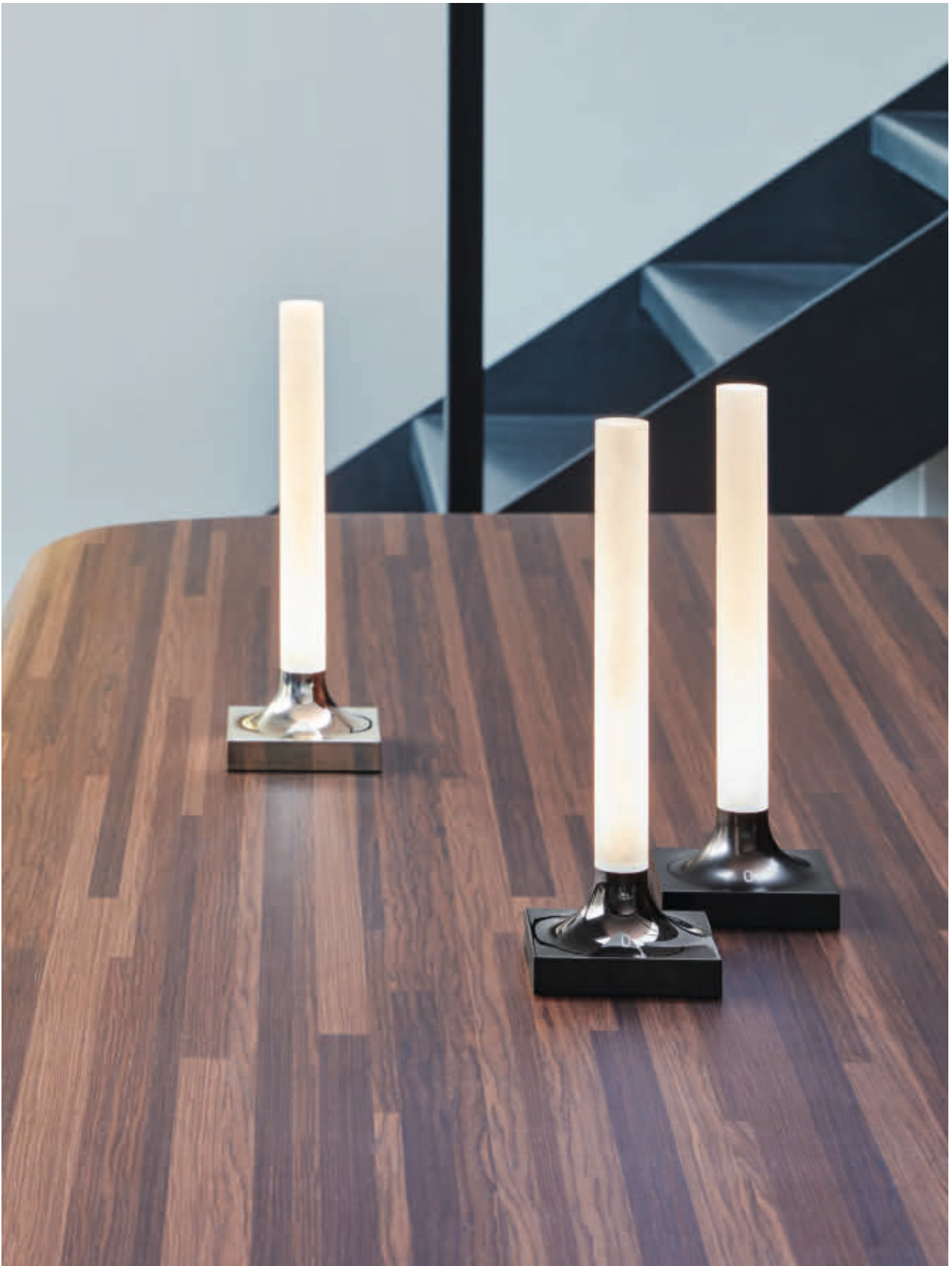
GOODNIGHT battery lamp des. P. Starck