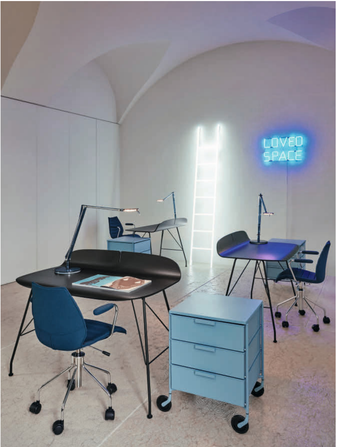
MAUI SOFT chair des. V. Magistretti