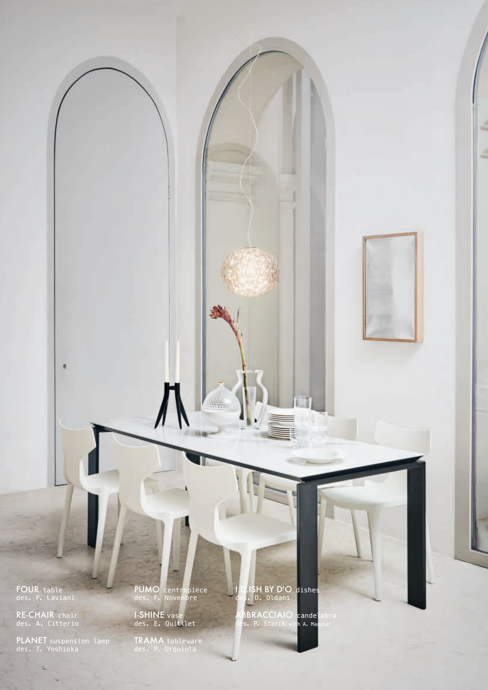
FOUR table des. F. Laviani