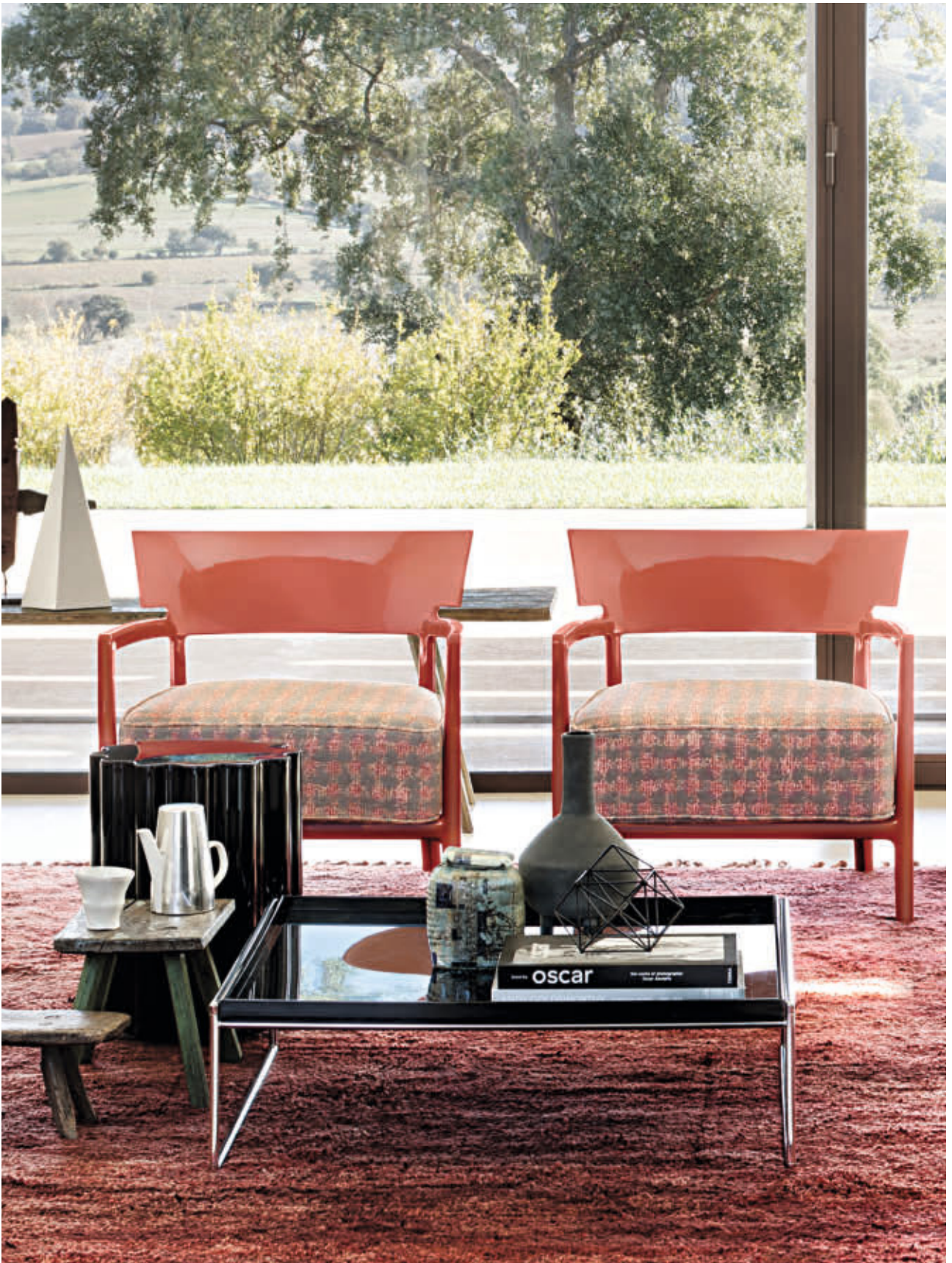
CARA armchair des. P. Starck