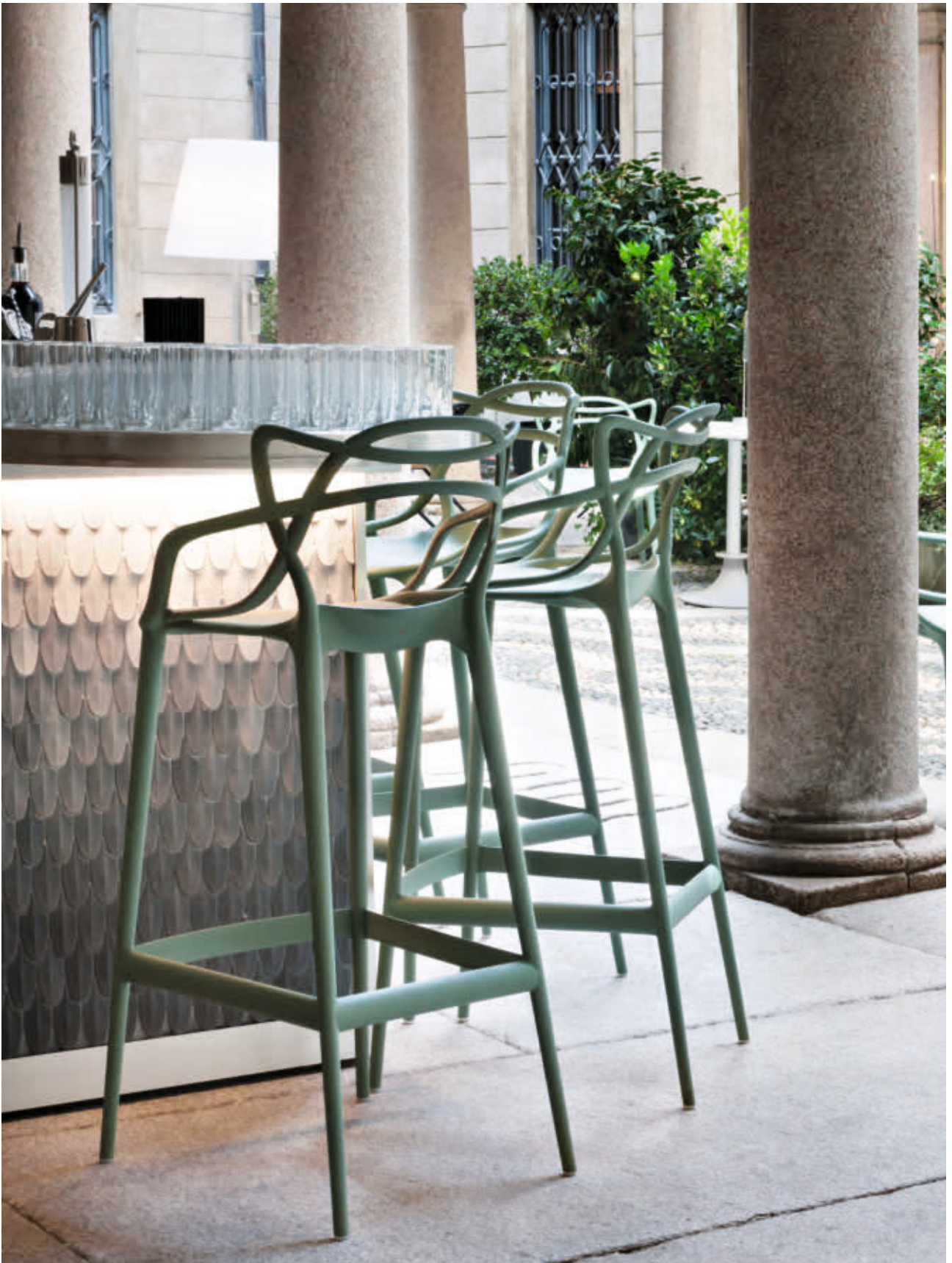
MASTERS STOOL stool des. P. Starck