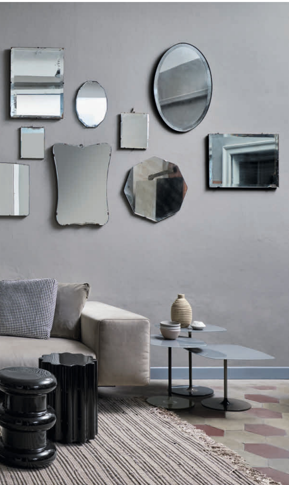
LARGO sofa des. P. Lissoni