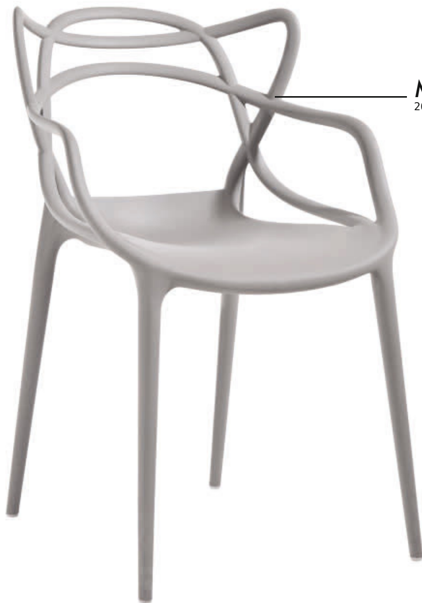
MASTERS 2010 des. P. Starck