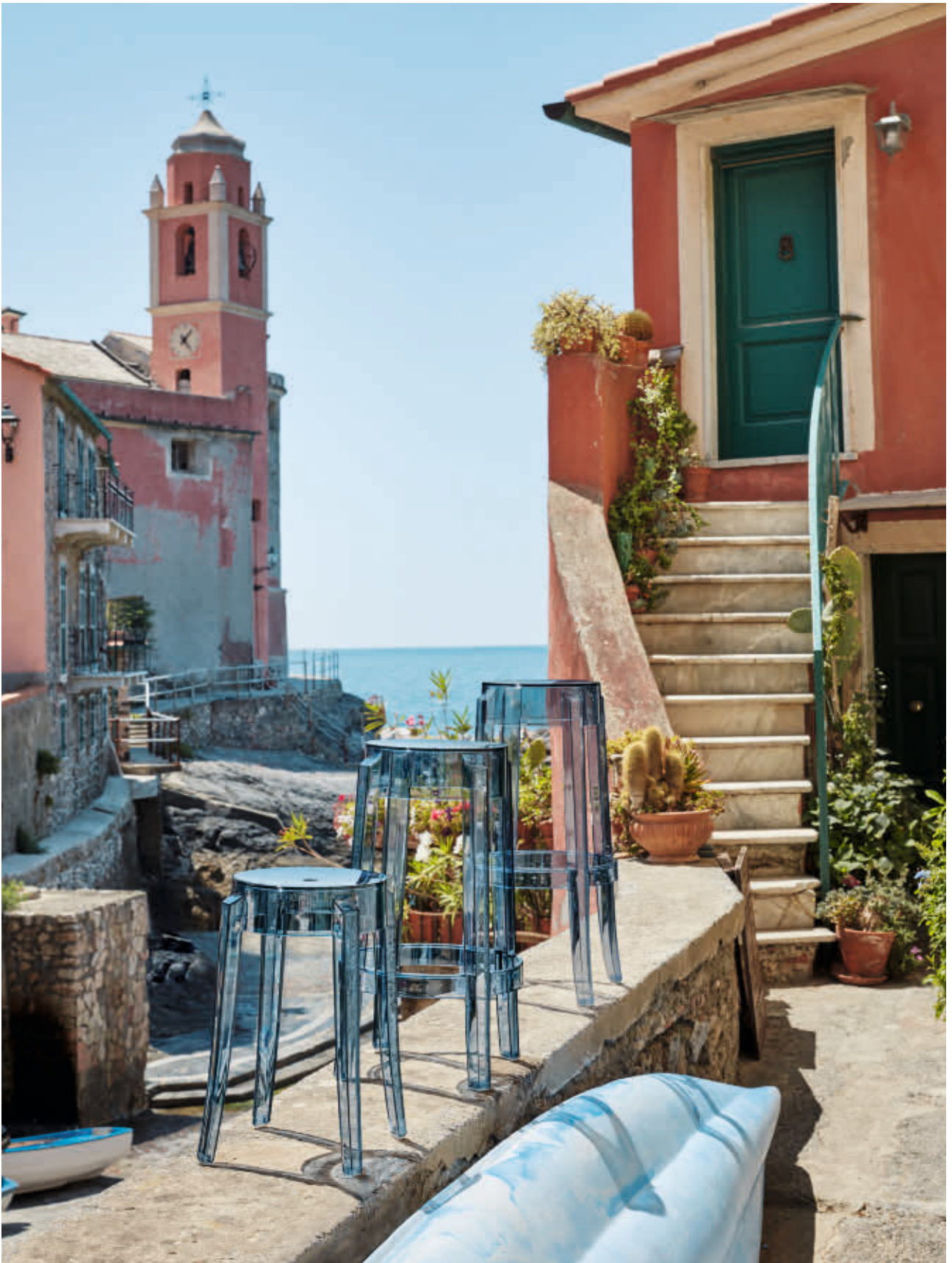
CHARLES GHOST stool des. P. Starck