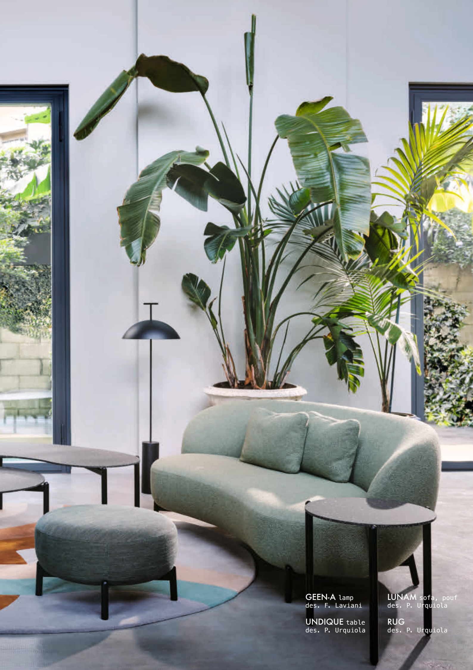
GEEN-A lamp des. F. Laviani