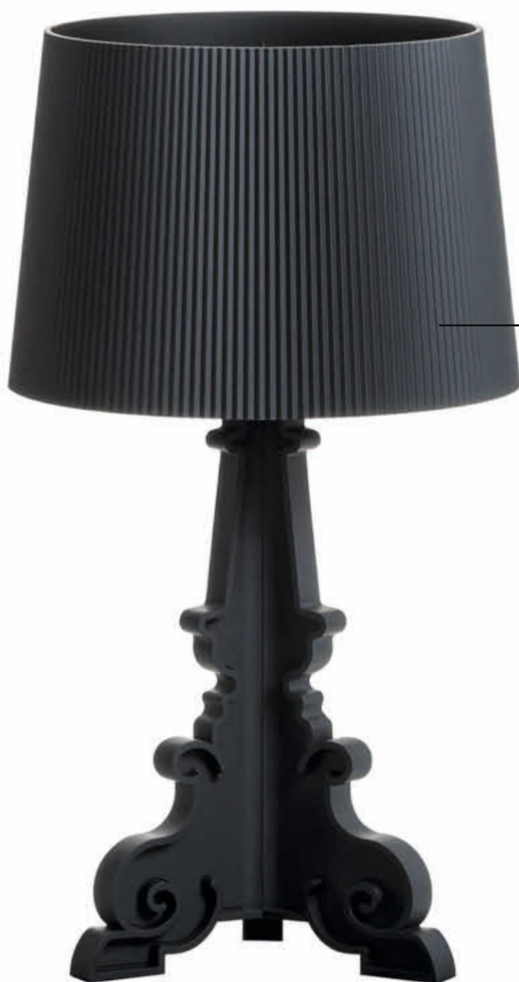
BOURGIE 2004 des. F. Laviani