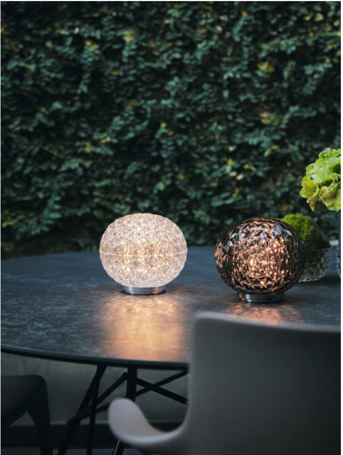
MINI PLANET table lamp des. T. Yoshioka