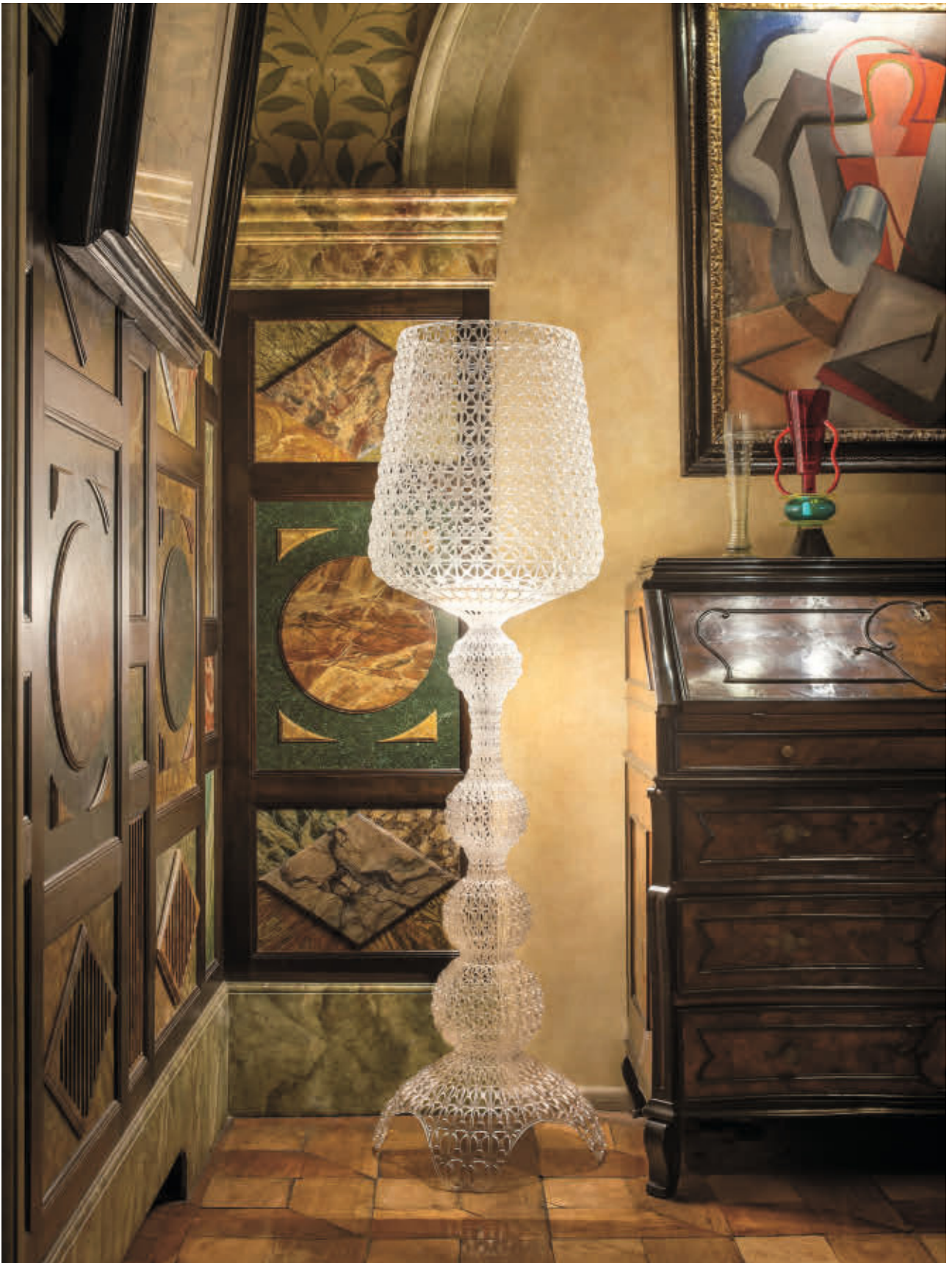
KABUKI lamp des. F. Laviani