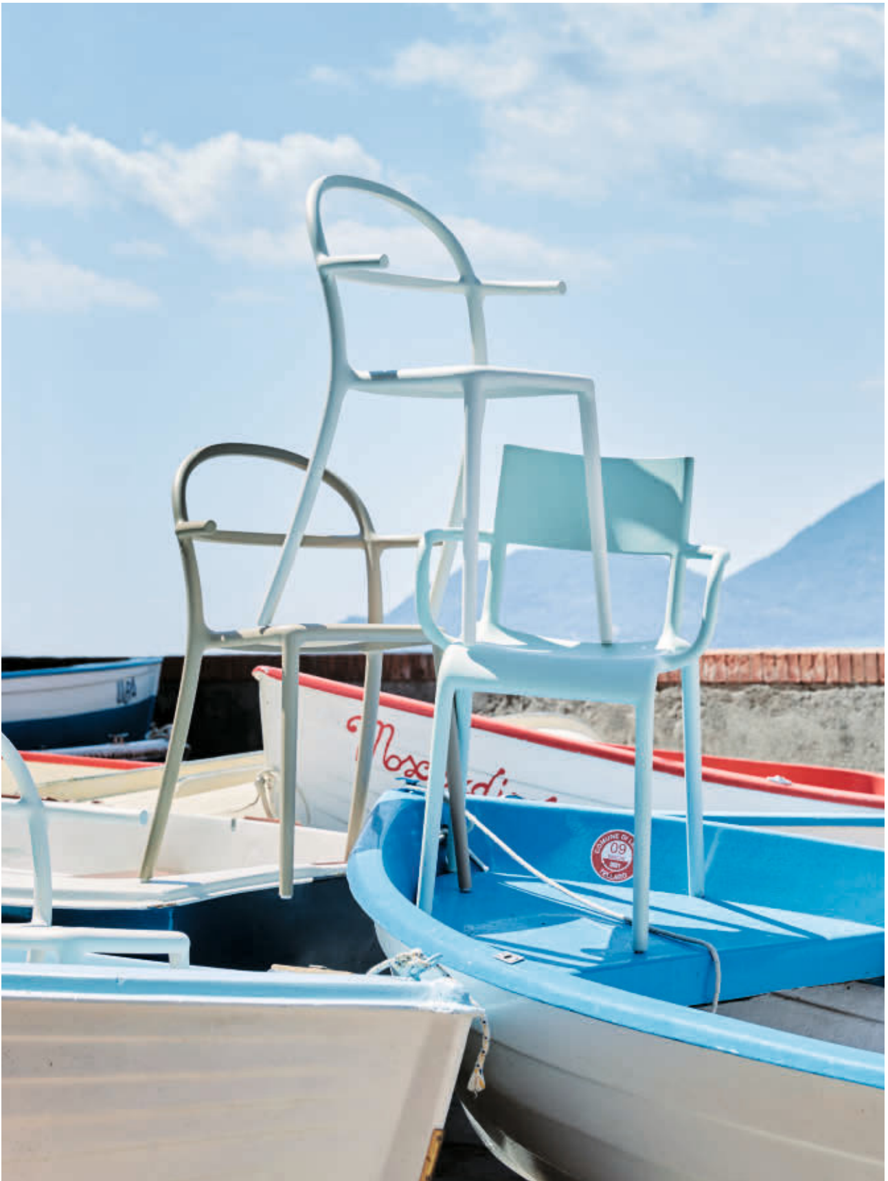
GENERIC A chair des. P. Starck