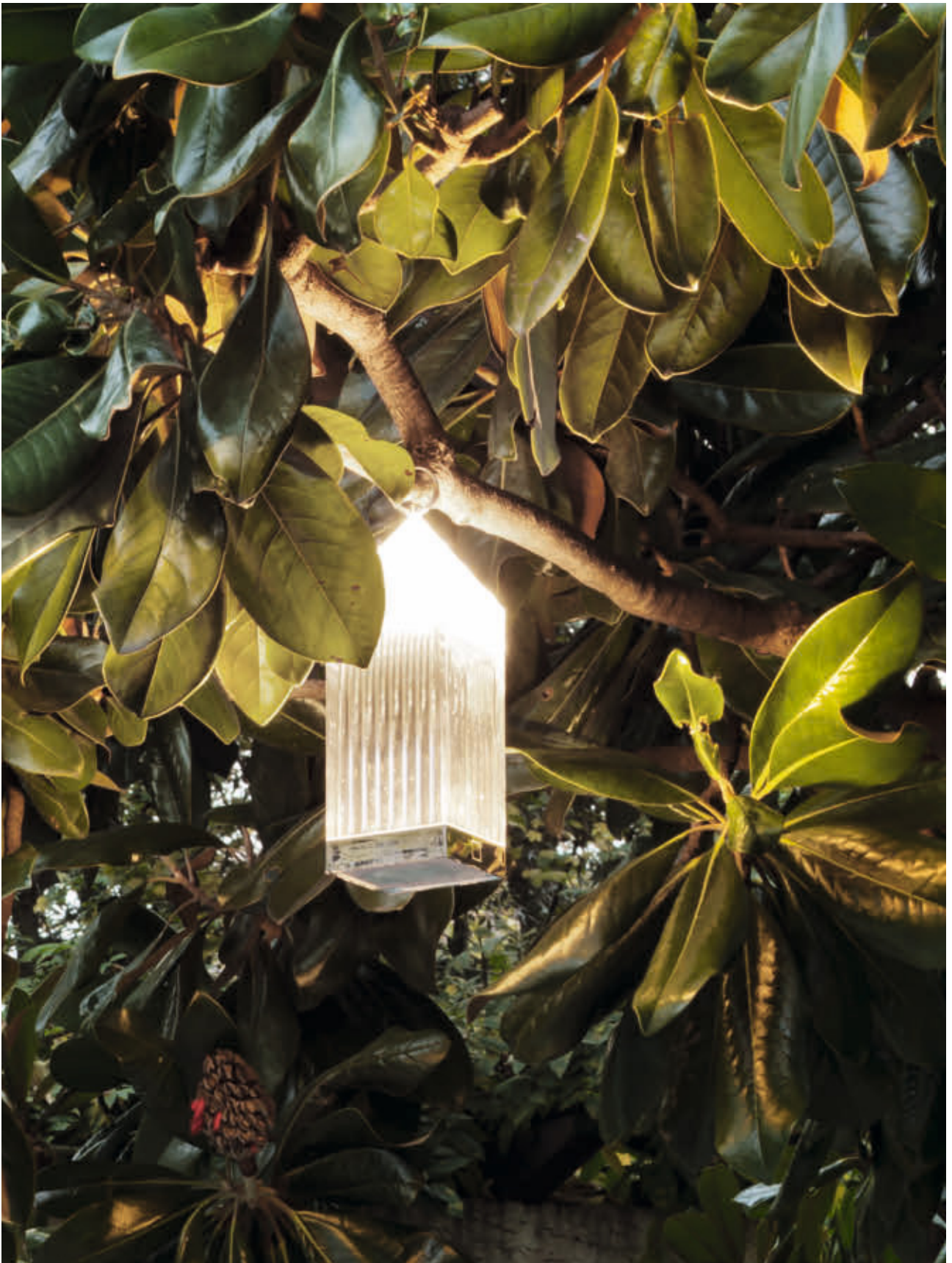
LANTERN lamp des. F. Novembre