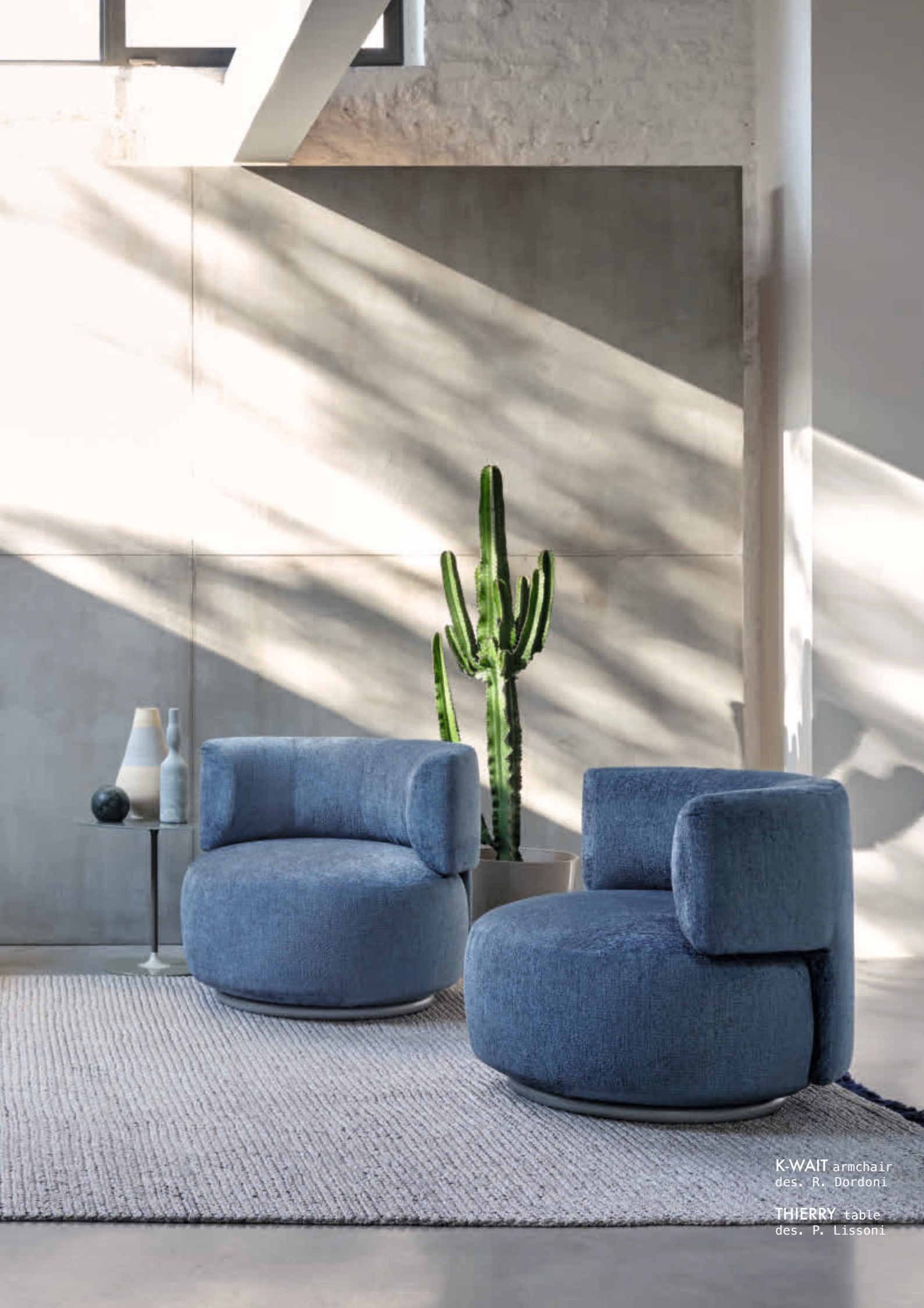
K-WAIT armchair des. R. Dordoni