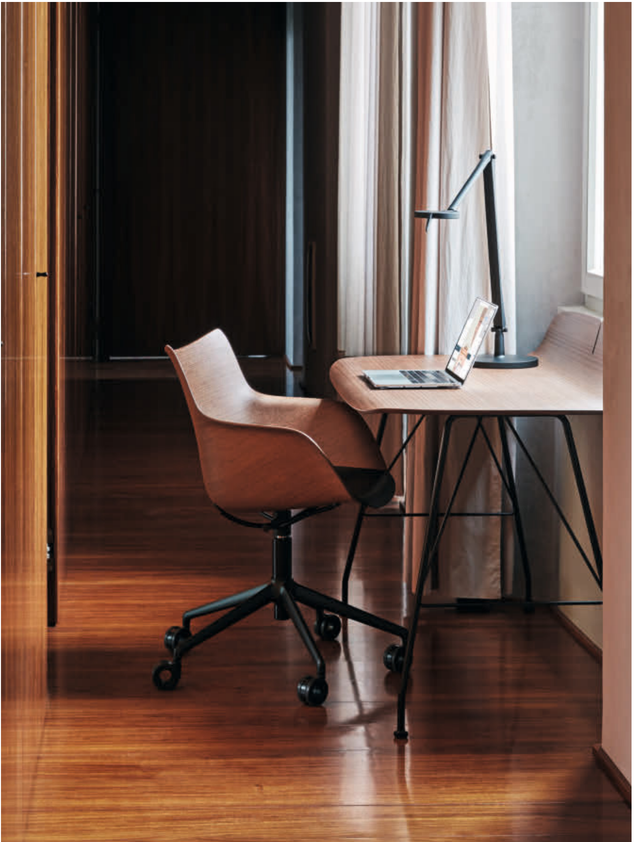
Q/WOOD chair des. P. Starck