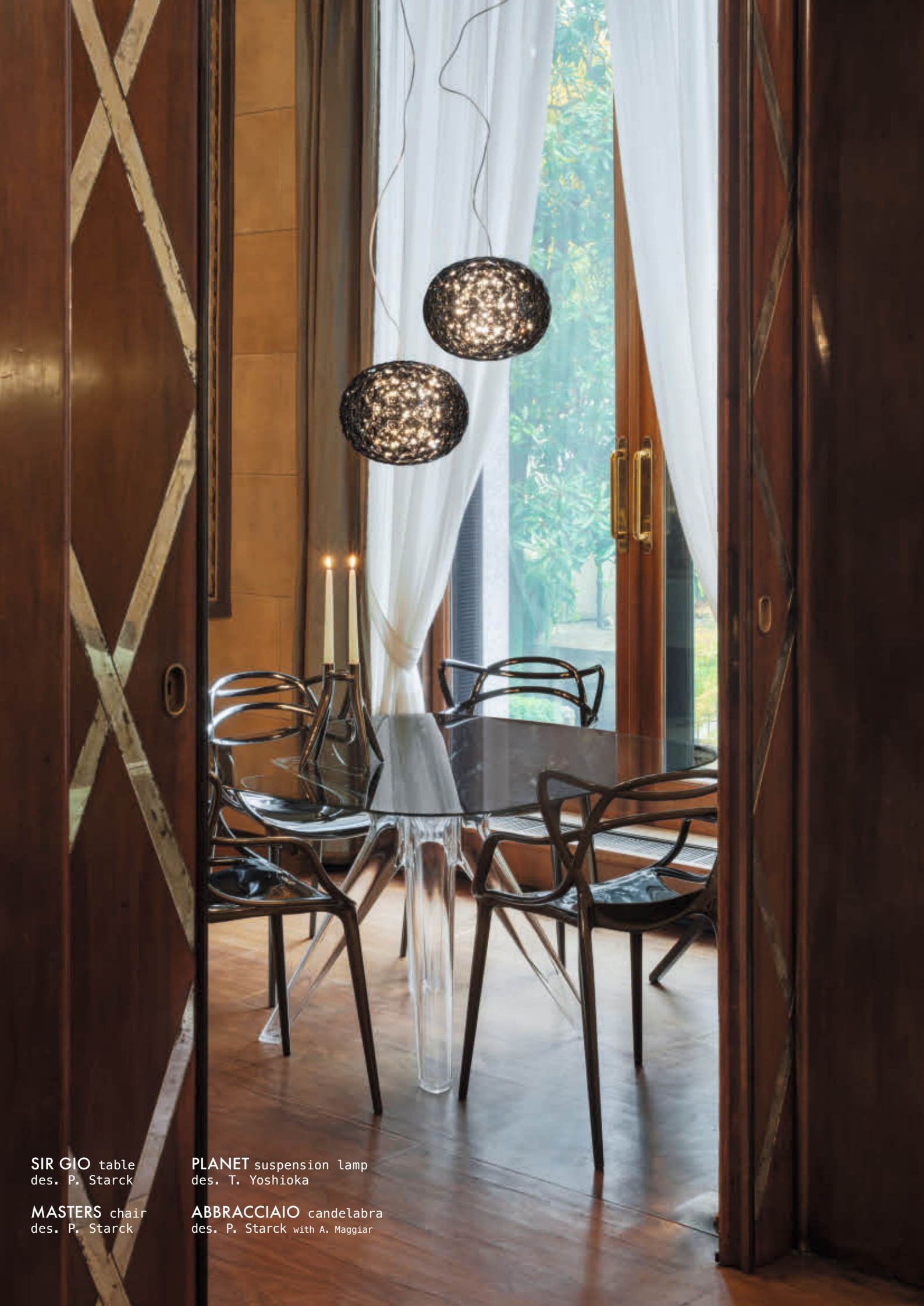
SIR GIO table des. P. Starck