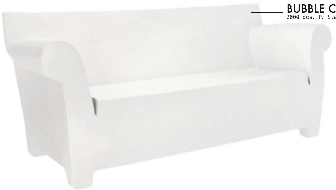
BUBBLE CLUB 2000 des. P. Starck