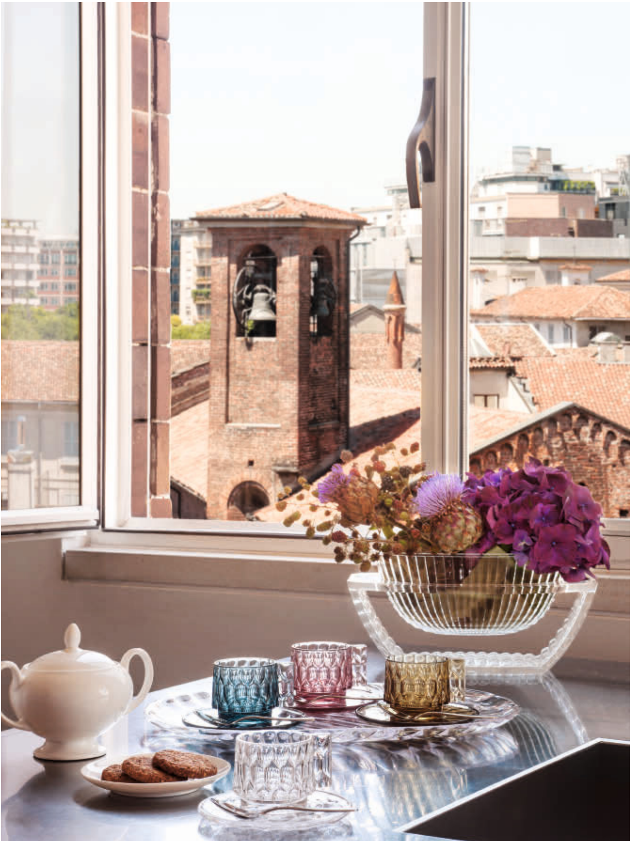
JELLIES FAMILY tableware des. P. Urquiola