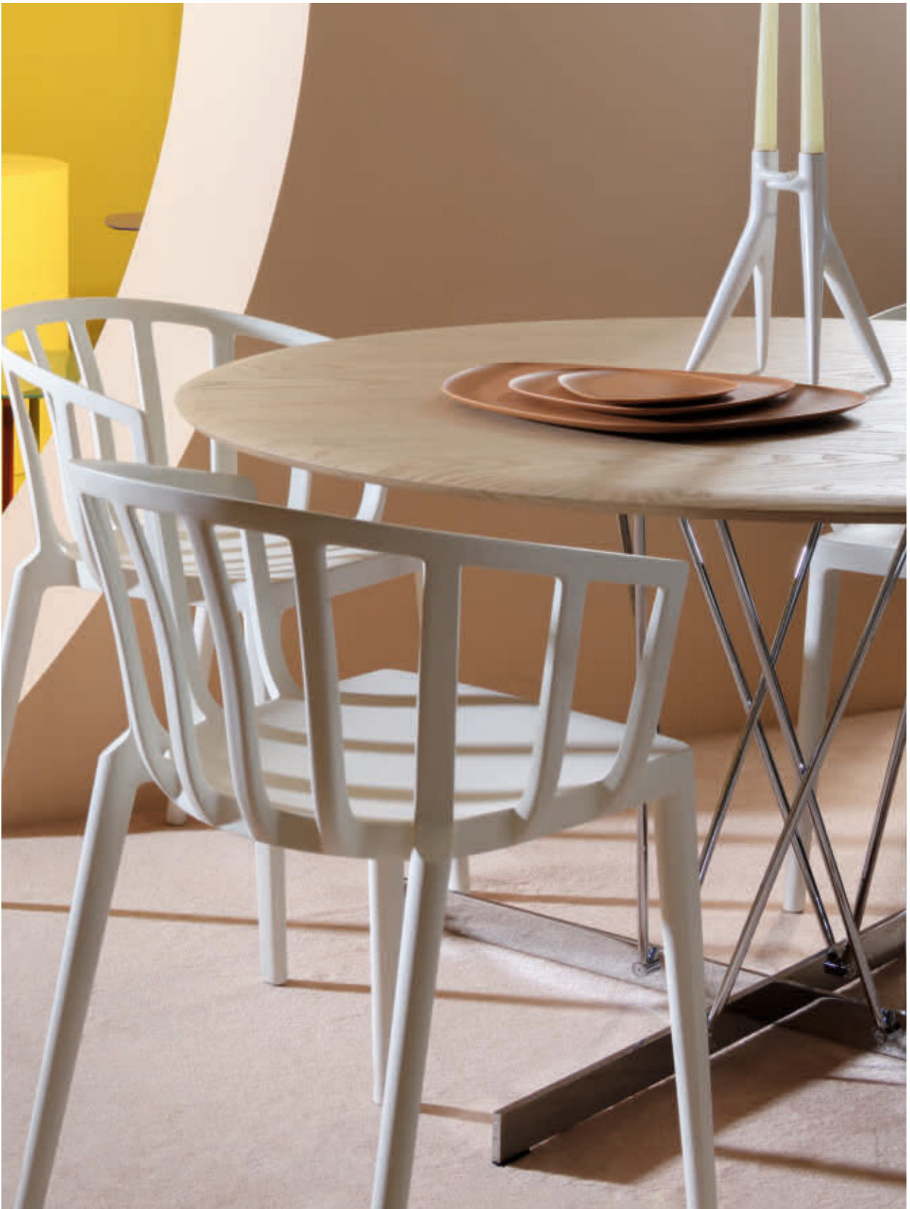
VISCOUNT OF WOOD table des. P. Starck