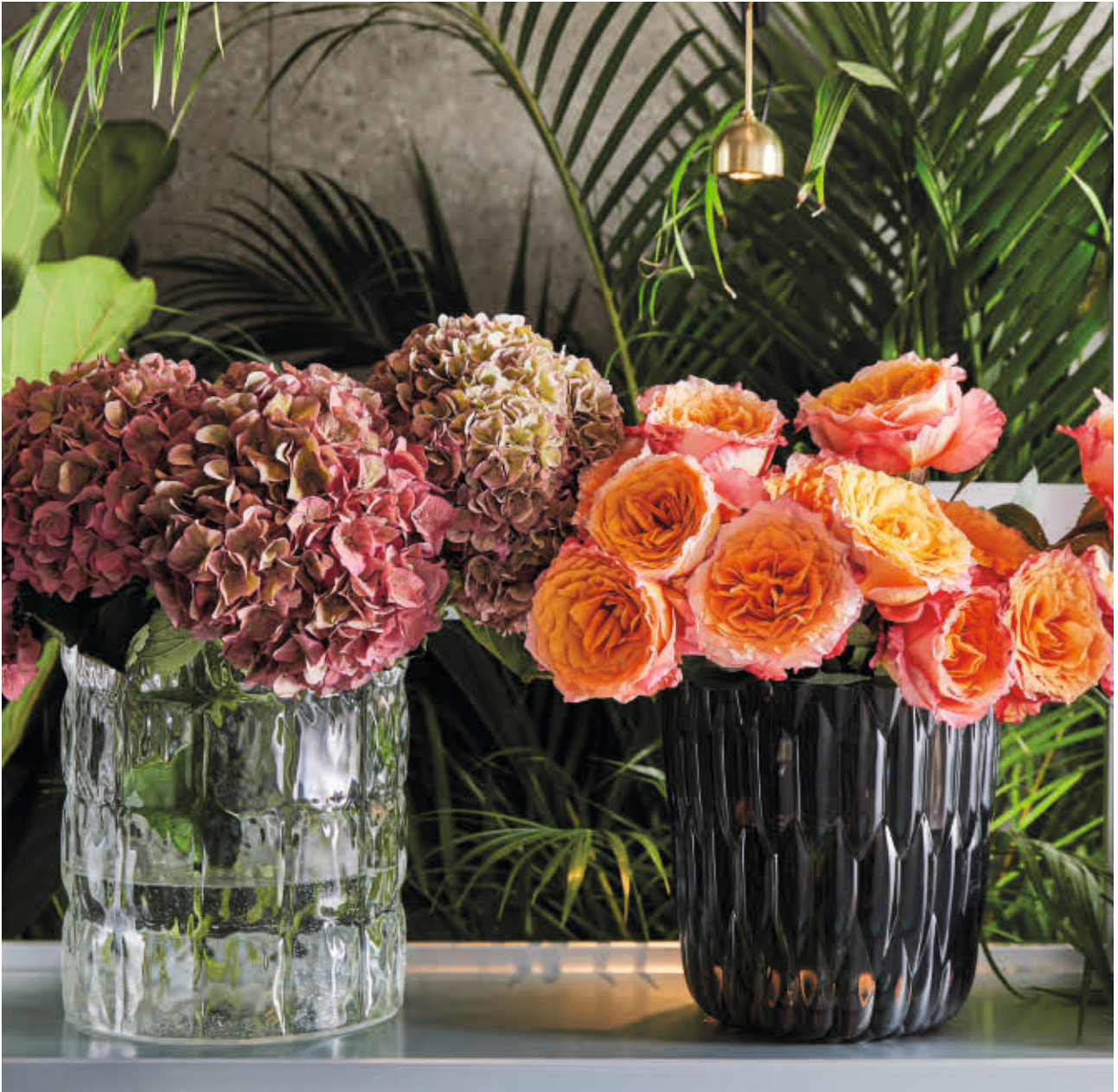
MATELASSÉ vase des. P. Urquiola