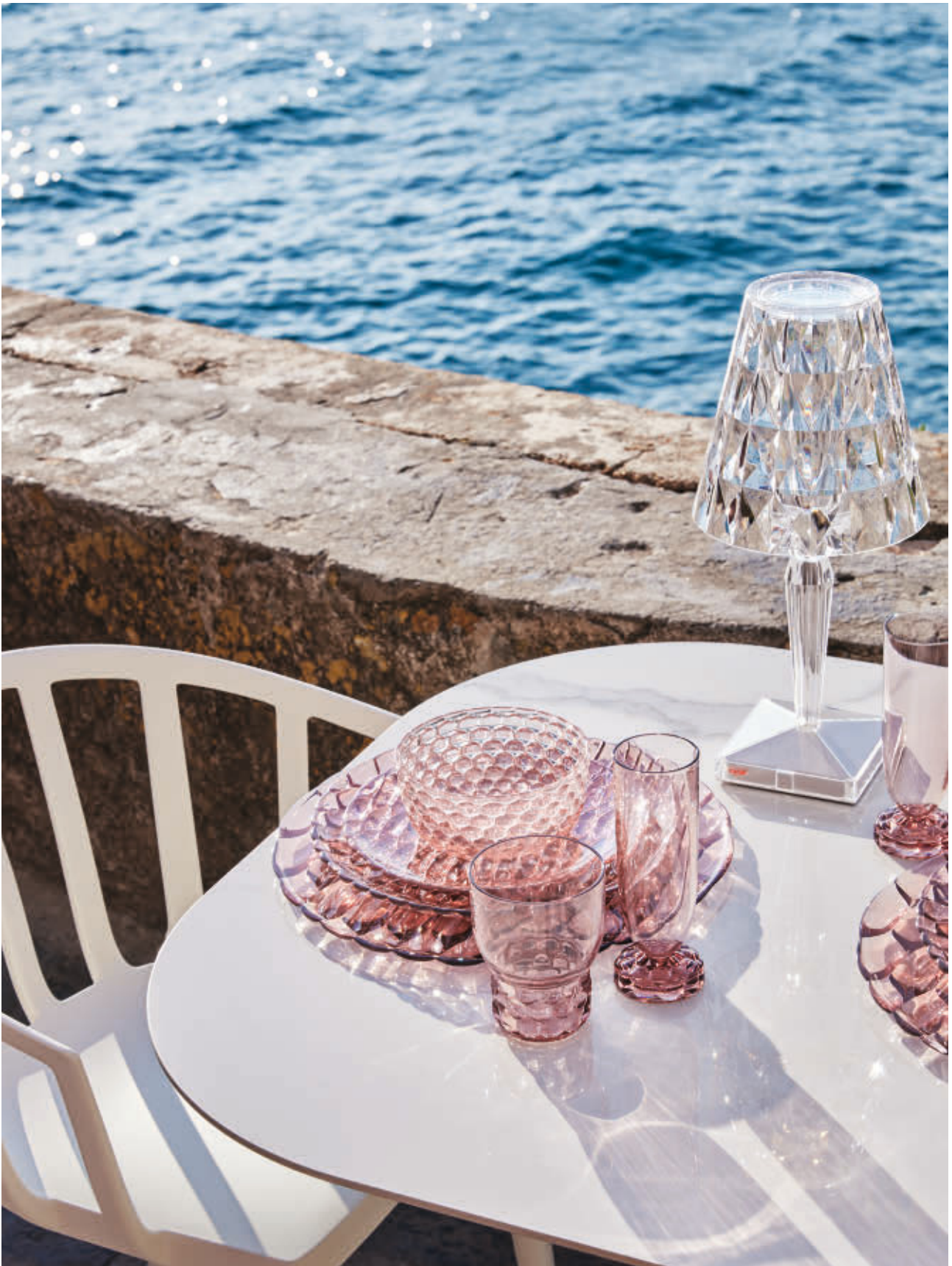
MULTIPLIO table des. A. Citterio