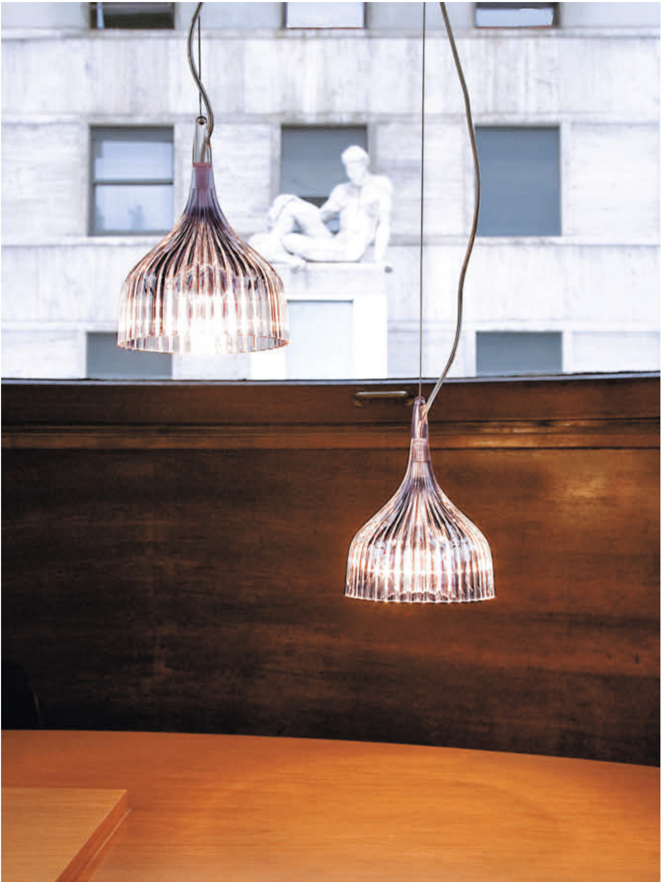
È suspension lamp des. F. Laviani