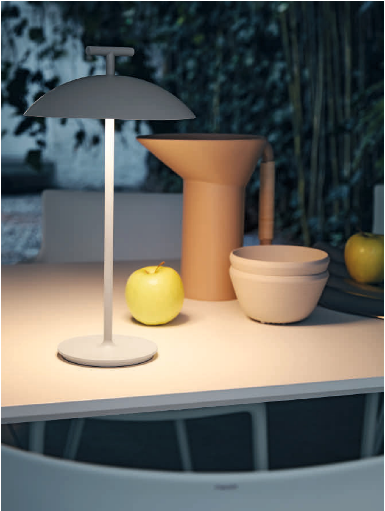
MINI GEEN-A table lamp des. F. Laviani