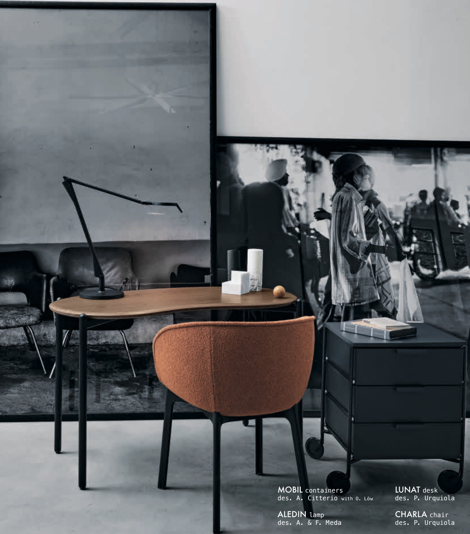
MOBIL containers des. A. Citterio with O. Löw