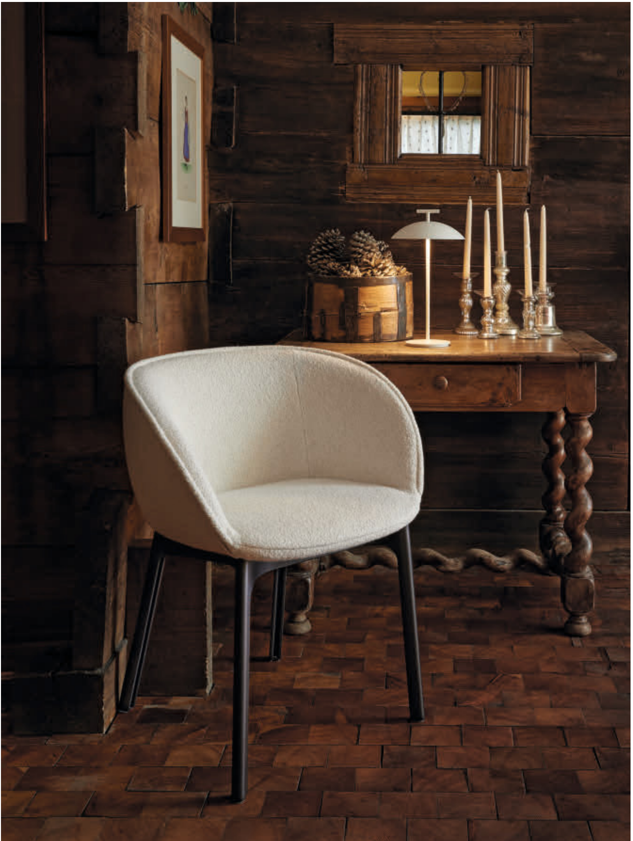
CHARLA chair des. P. Urquiola