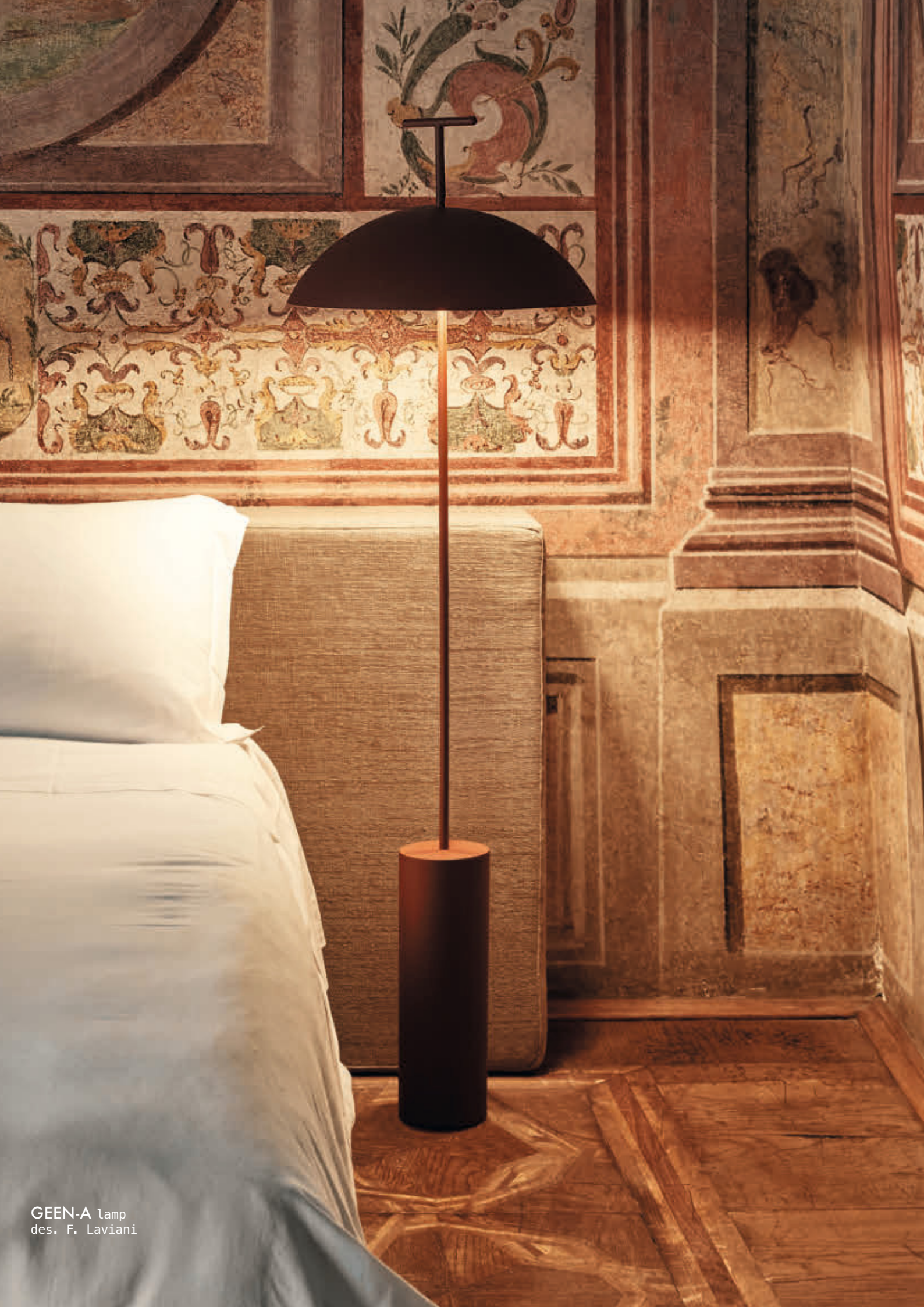
GEEN-A lamp des. F. Laviani