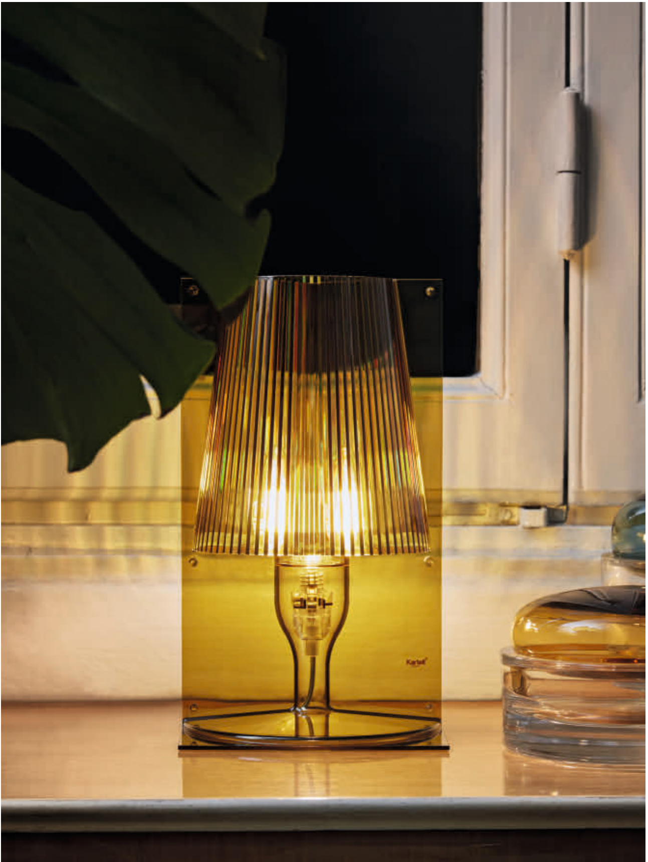
TAKE table lamp des. F. Laviani