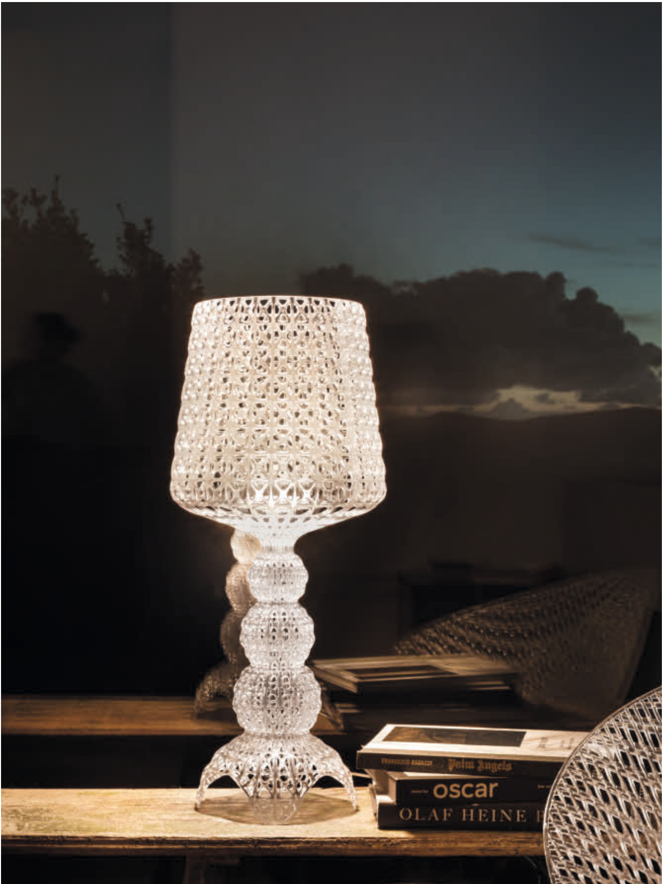
MINI KABUKI table lamp des. F. Laviani