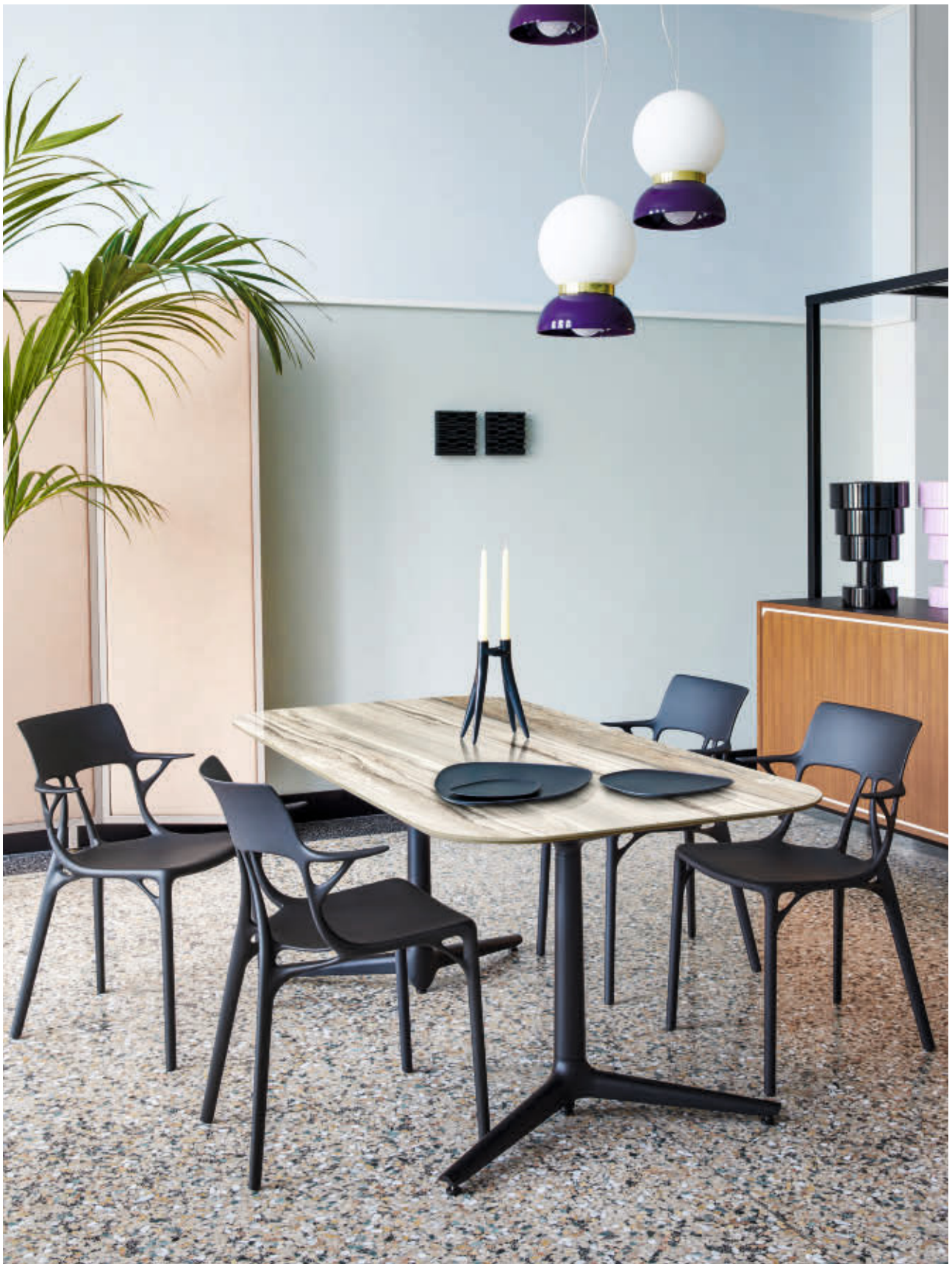
MULTIPLIO table des. A. Citterio