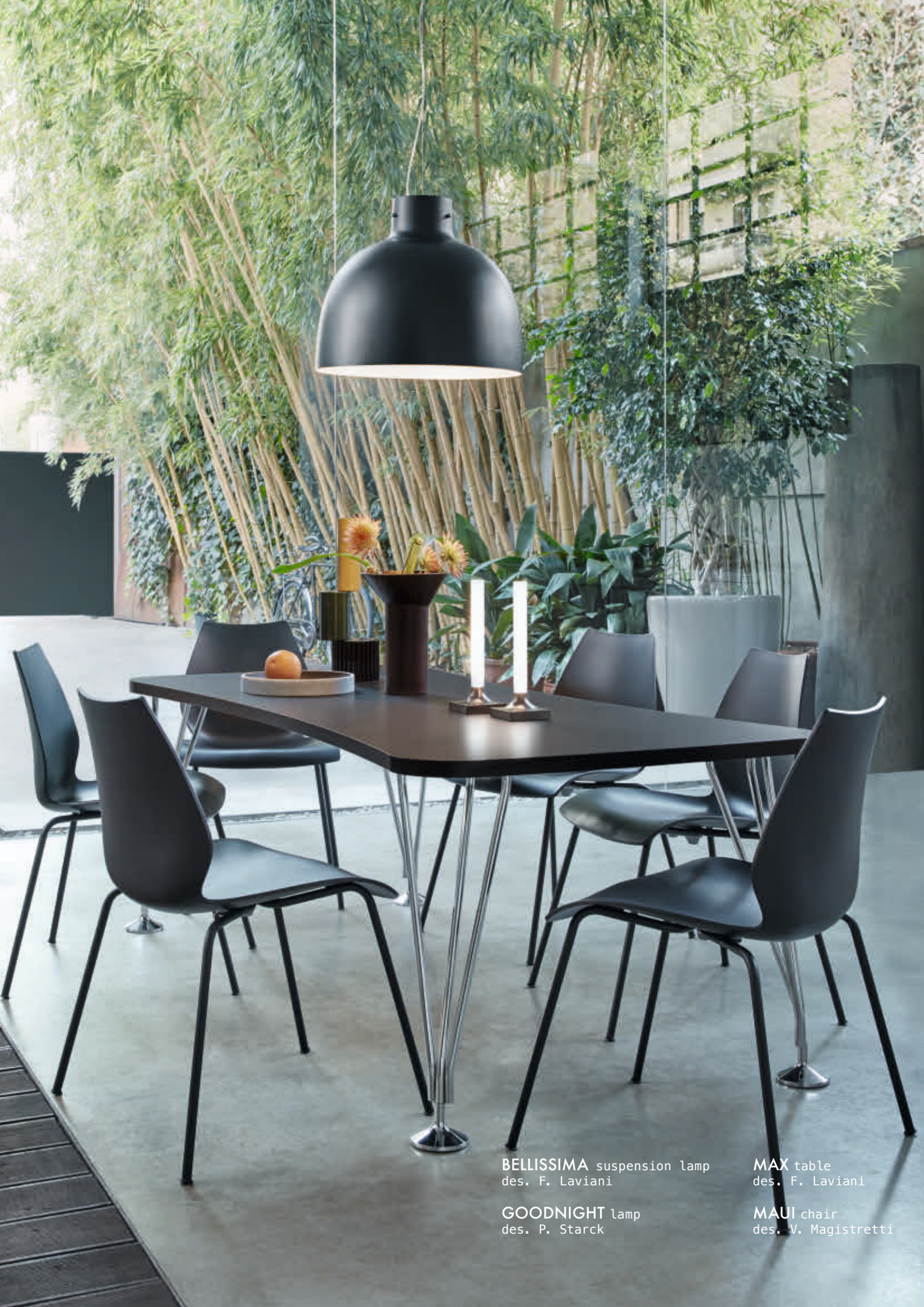
BELLISSIMA suspension lamp des. F. Laviani