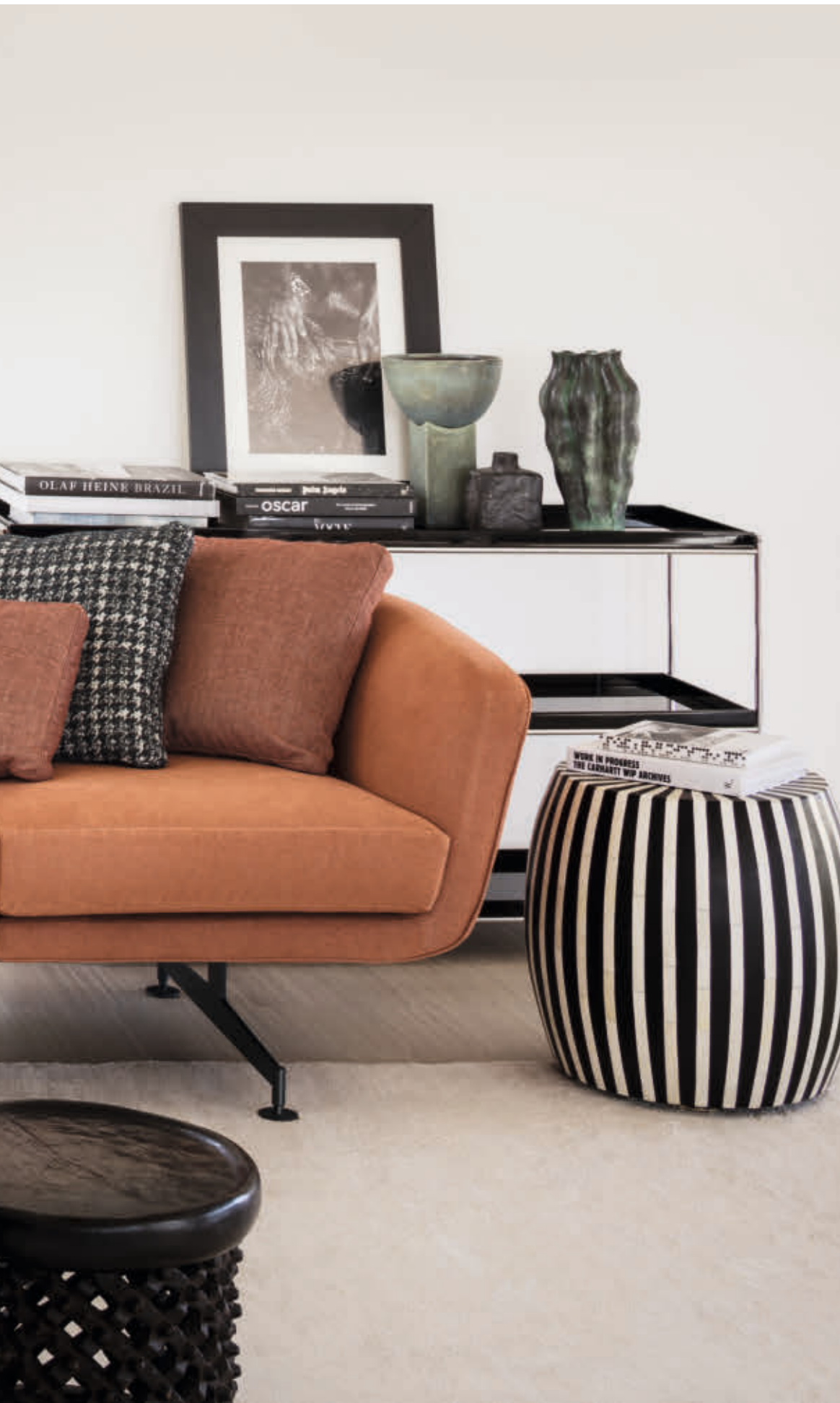
BETTY sofa des. P. Lissoni