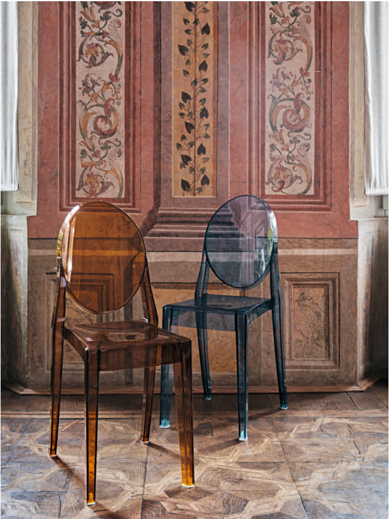
VICTORIA GHOST chair des. P. Starck