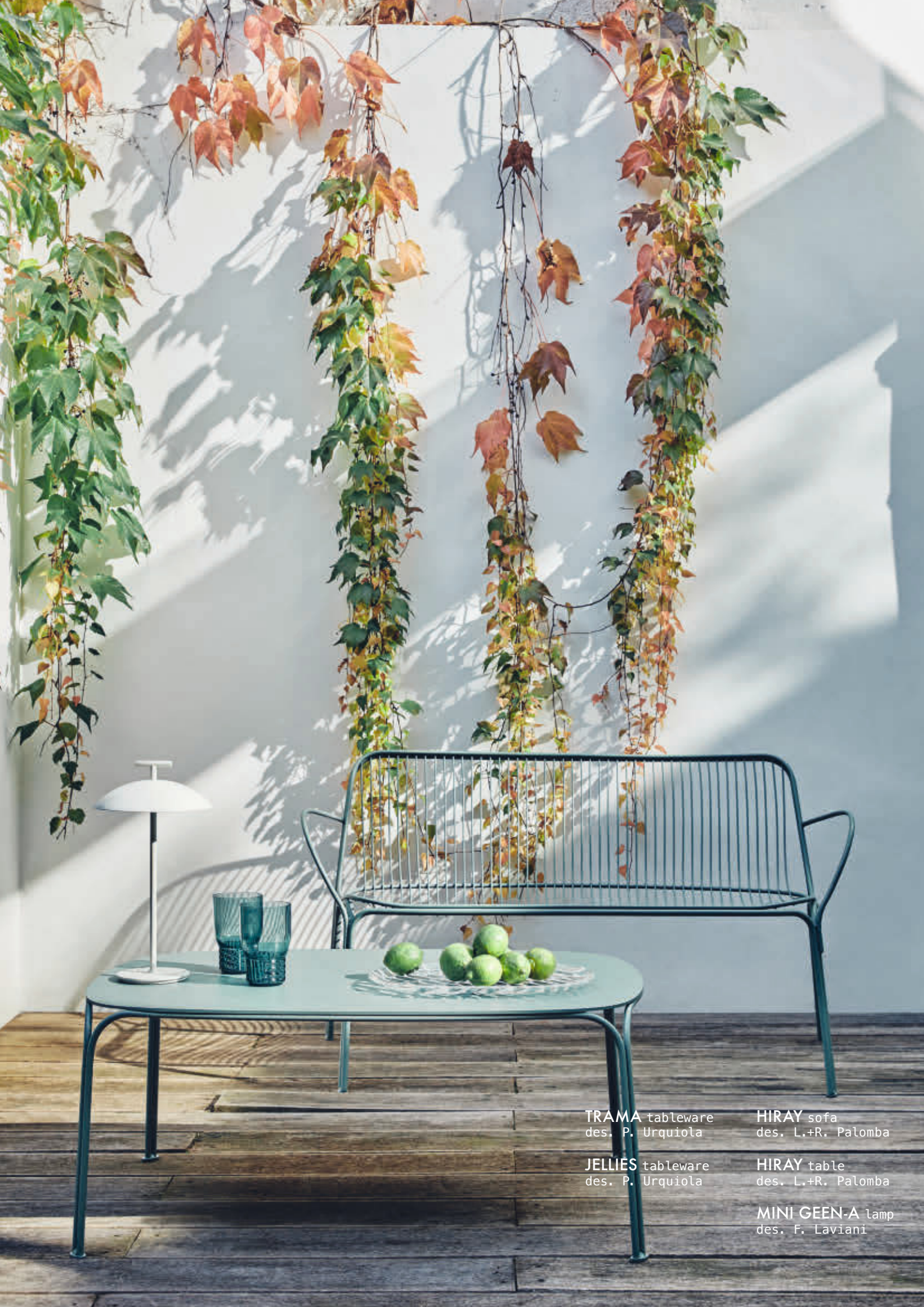
TRAMA tableware des. P. Urquiola