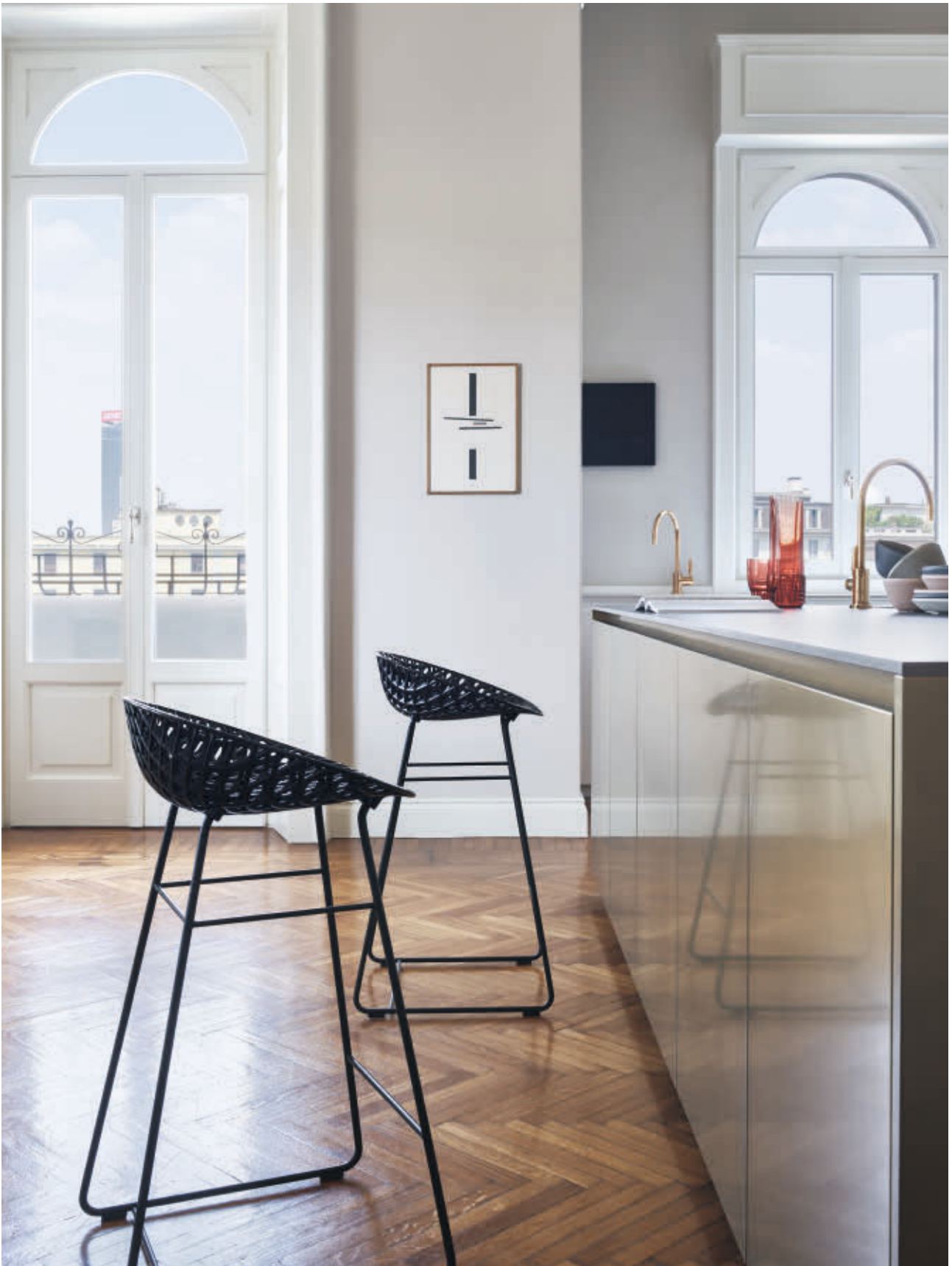
SMATRIK STOOL stool des. T. Yoshioka