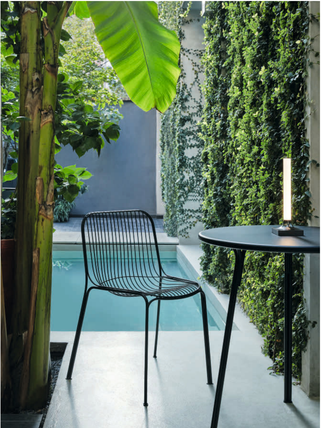
HIRAY chair des. L.+R. Palomba