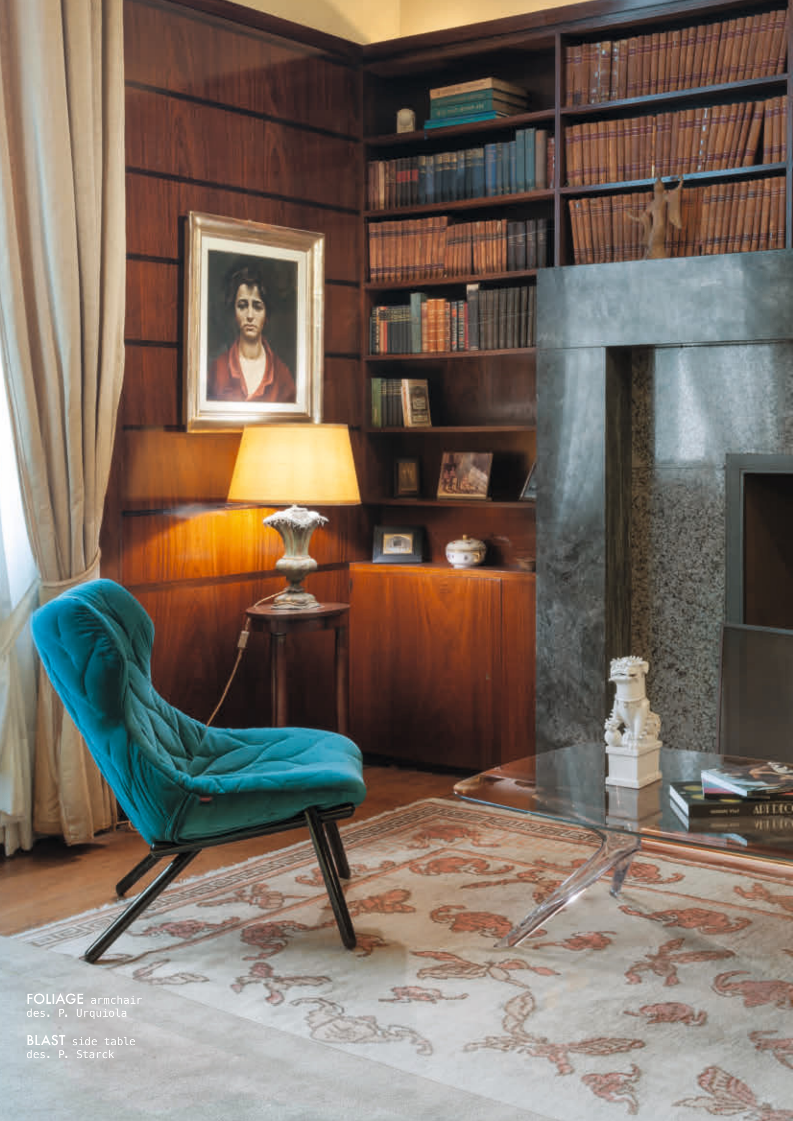
FOLIAGE armchair des. P. Urquiola