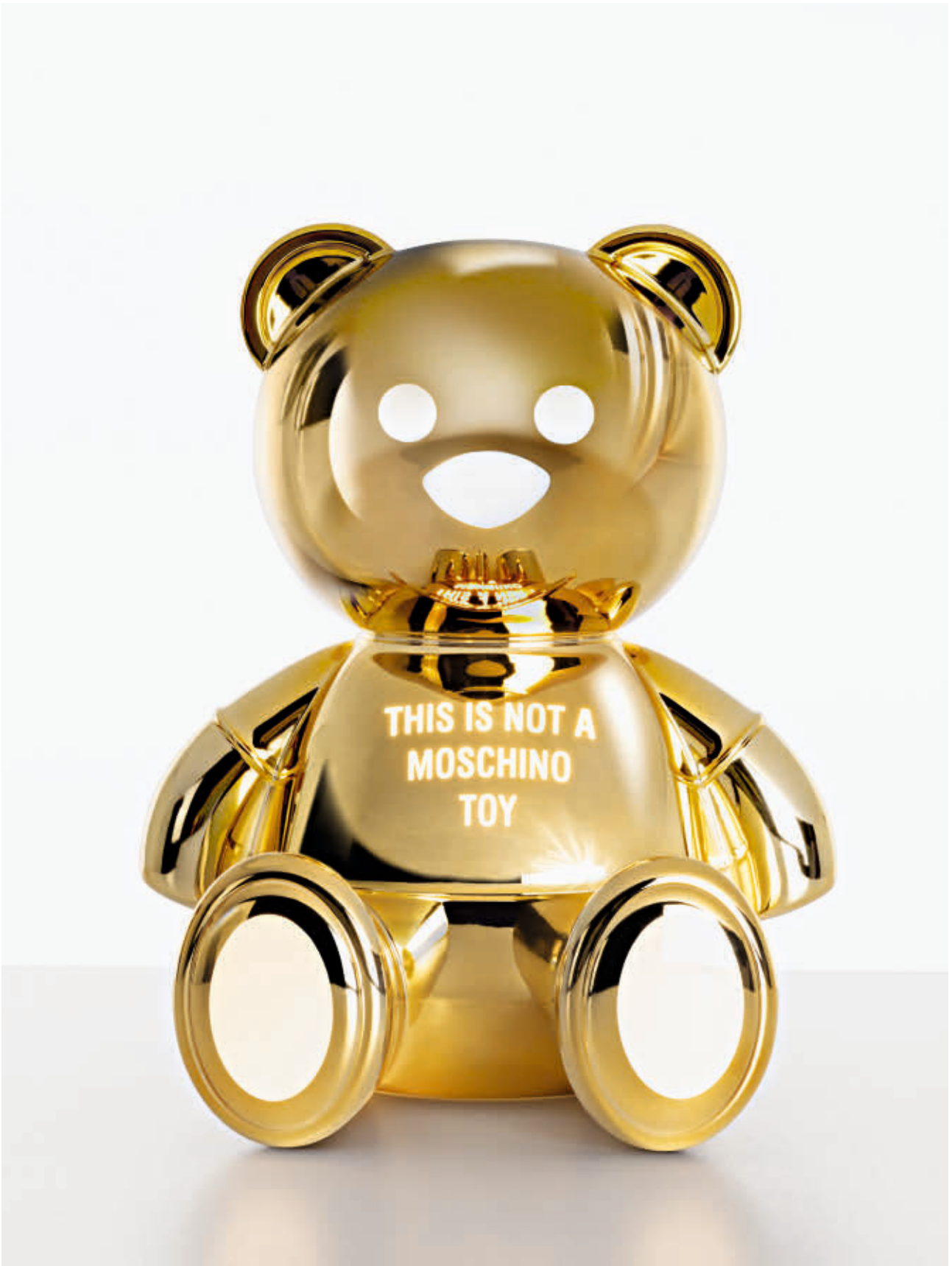
TOY table lamp des. Moschino by Jeremy Scott