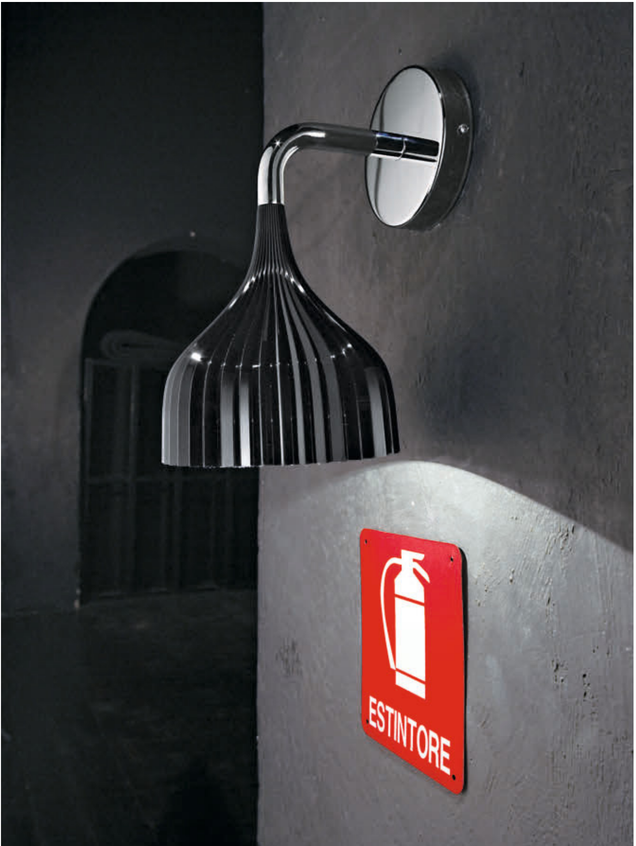
È wall lamp des. F. Laviani