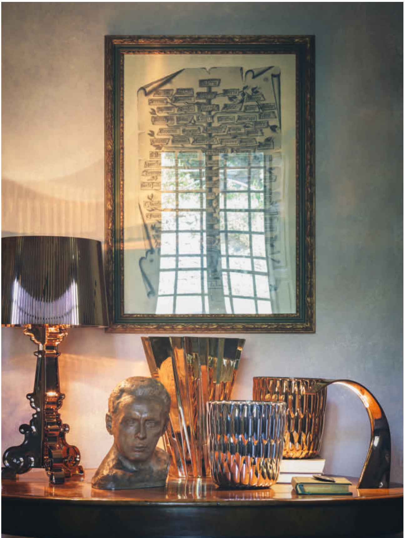
BOURGIE table lamp des. F. Laviani