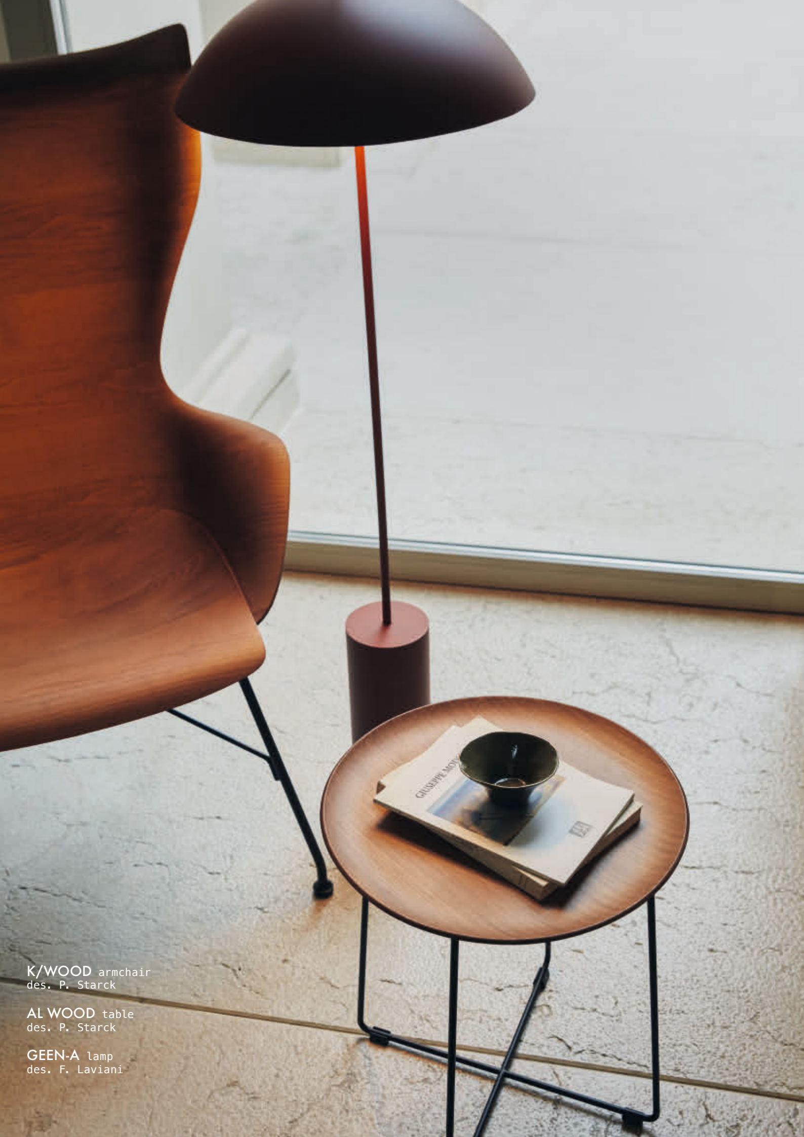
K/WOOD armchair des. P. Starck