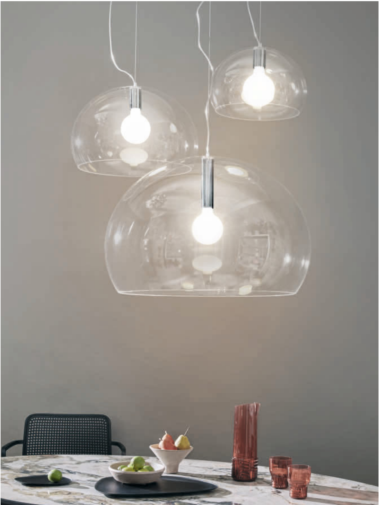
FL/Y suspension lamp des. F. Laviani