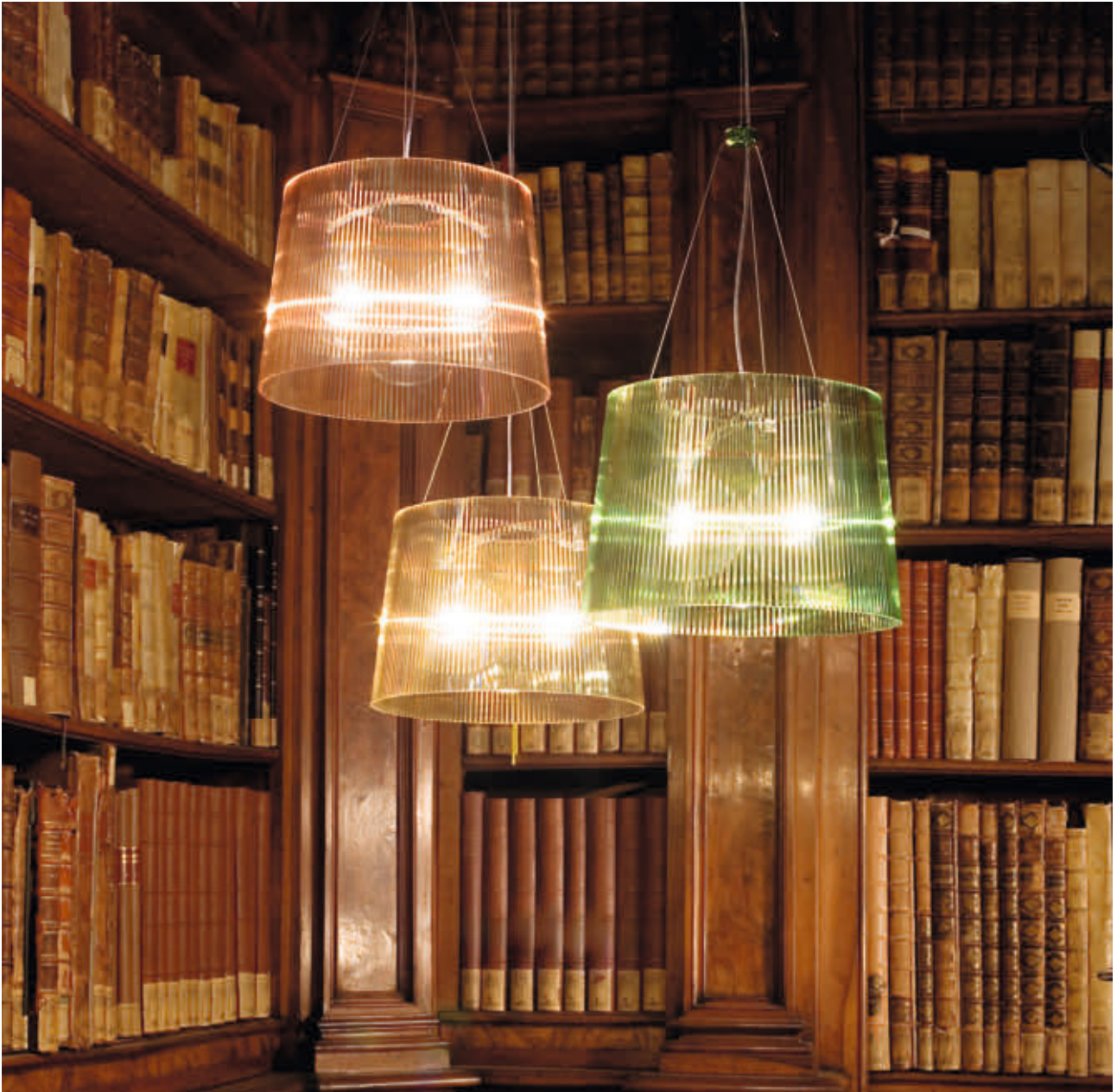
GÈ suspension lamp des. F. Laviani