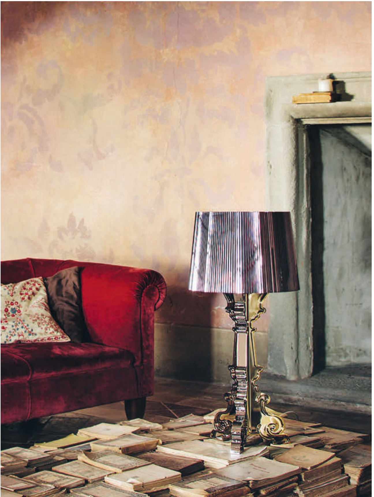
BOURGIE table lamp des. F. Laviani